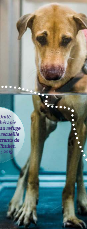
Photo : Unité de physiothérapie pour chiens, au refuge Soï Dog, qui recueille des chiens errants de la ville de Phuket, Thaïlande, 2019.

Jacques Derrida, philosophe, dans De quoi demain... Dialogue, avec Elisabeth Roudinesco , 2001.