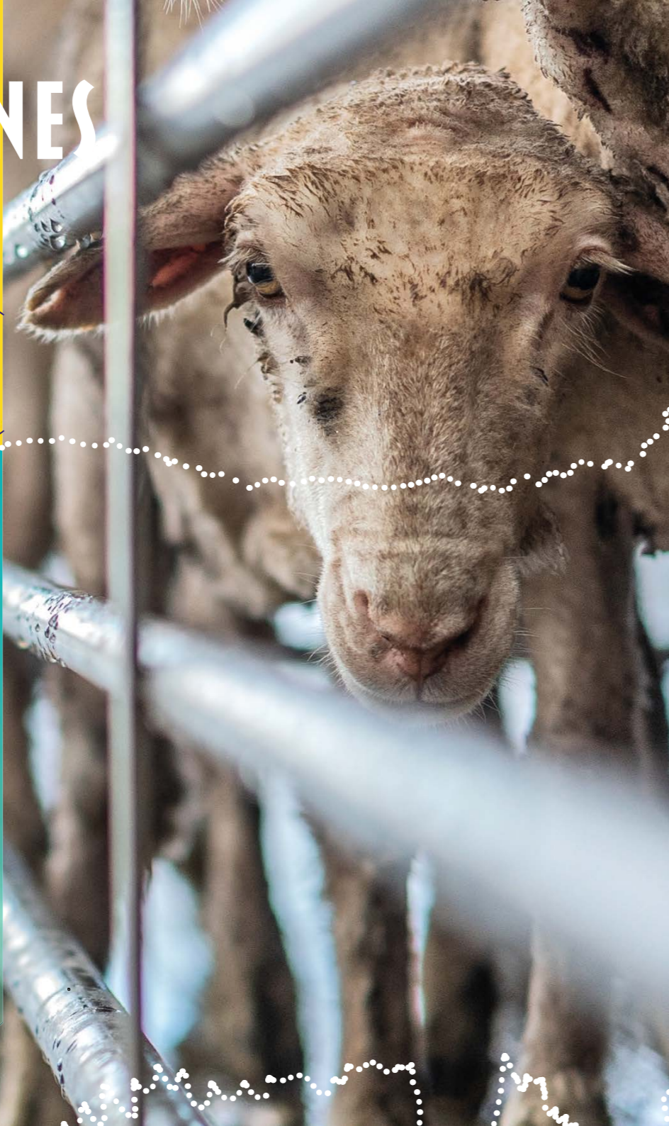
Photo : Transport d'animaux vivants. Une brebis en attente d'être embarquée pour une exportation par voie maritime. Australie, 2018.

Steven Wise, dans L'Avocat des chimpanzés , documentaire, 2016.