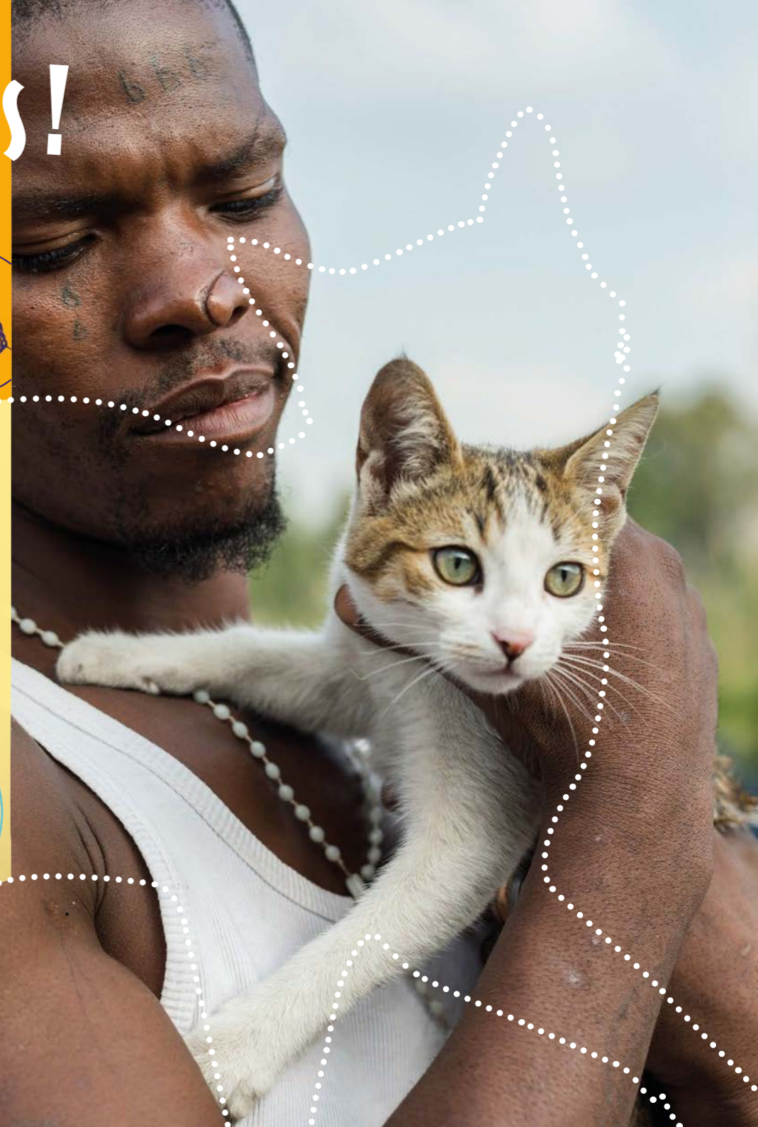
Photo : Un habitant du bidonville de Randfontein et son chat prénommé Freedom. Freedom est soigné par l'association CLAW, qui fournit des soins vétérinaires gratuits aux populations démunies. Afrique du Sud, 2016.

Jean-Jacques Rousseau, philosophe, dans Discours sur l'origine et les fondements de l'inégalité parmi les hommes , 1755.