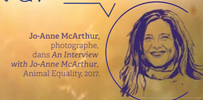
Jo-Anne McArthur, photographe, dans An Interview with Jo-Anne McArthur , Animal Equality, 2017.

Photo : Capucine, truie rescapée de l'élevage intensif au refuge GroinGroin, France, 2021