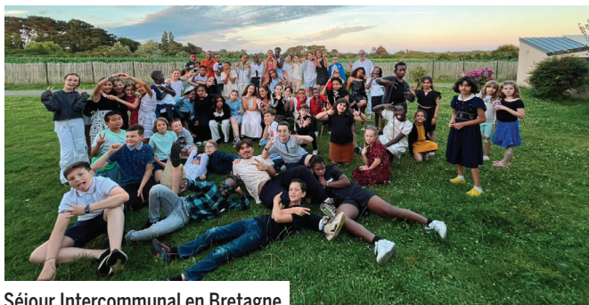
Séjour Intercommunal en Bretagne