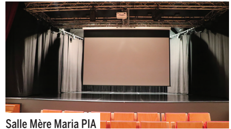
Salle Mère Maria PIA