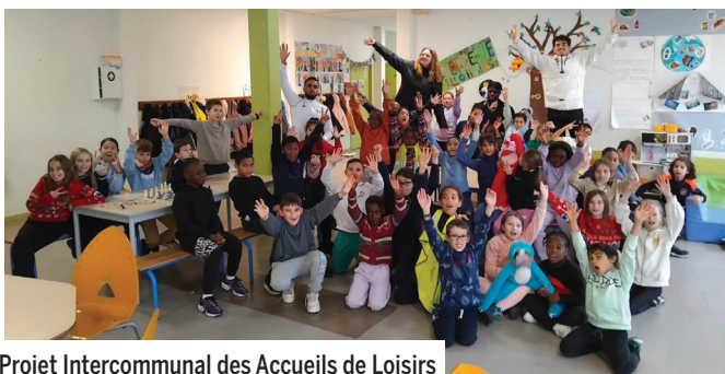
Projet Intercommunal des Accueils de Loisirs