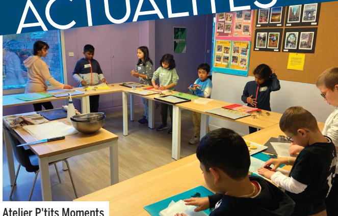
Atelier P'tits Moments