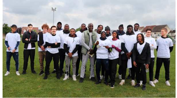
Lors des Rencontres d'athlétisme organisées pour les élèves des écoles élémentaires de la ville, les stagiaires BPJEPS ont effectué leur stage pratique en encadrant et en animant les ateliers. Ici en photo avec Olivier NYOKAS champion du monde de handball (au centre).

À la rentrée 25 nouveaux stagiaires issus principalement de l'agglomération ont intégré un nouveau cycle de formation.