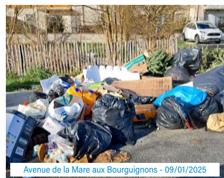
Avenue de la Mare aux Bourguignons - 09/01/2025