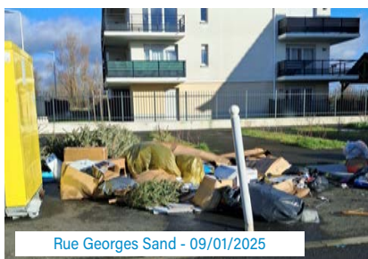
Rue Georges Sand - 09/01/2025