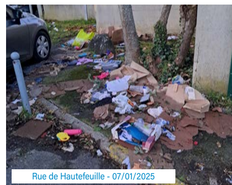
Rue de Hautefeuille - 07/01/2025

https://www.coeuressonne.fr/vos-services/gestion-des-dechets/