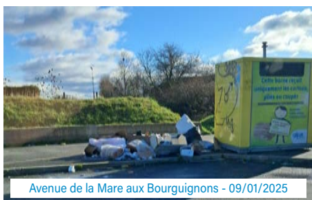
Avenue de la Mare aux Bourguignons - 09/01/2025