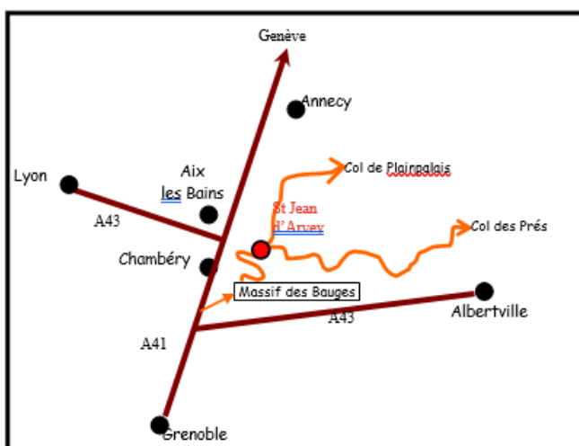
Situation et plan d'accès

Occupant une position de porte, à l'entrée du massif des Bauges, Saint-Jean d'Arvey tente néanmoins de conserver un équilibre entre un site naturel privilégié et un espace bâti maîtrisé avec aujourd'hui une population de 1753 habitants ; 317 ont moins de 14 ans. Le taux de natalité de 11.3% est stable depuis près de 30 ans. Près de la moitié de la population réside dans la commune depuis moins de 10 ans.