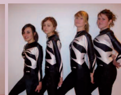
Equipe Interrégionale N7, Nationale N6 et Individuelles Nationales entraînées par Audrey T