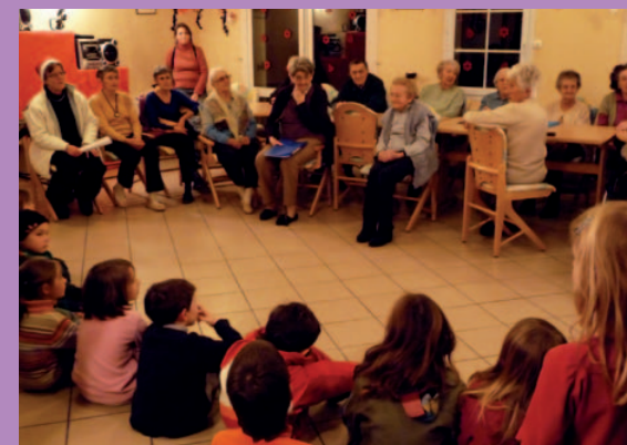
Ecoute attentive d'une lecture de conte à la MARPA, lors de la Nuit des lumières

La vie à la MARPA ne nous laisse pas le temps de reprendre notre souffle et déjà nous pensons aux prochaines animations qui germent dans la tête de notre animatrice. Que va t-il encore se passer ?