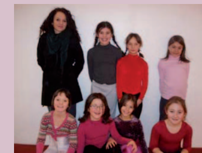
Equipe Interrégionale N8 avec Mégéy