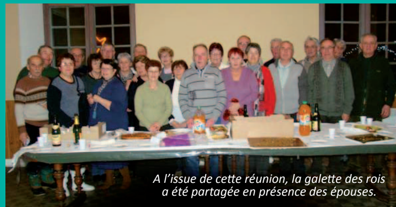
A l'issue de cette réunion, la galette des rois a été partagée en présence des épouses.