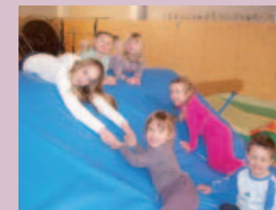
Quelques « Petits Acrobates » (Trop de neige ce jour là !)