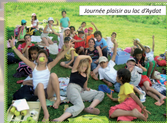
Journée plaisir au lac d'Aydat

Ce qui a donc changé depuis le début c'est la professionnalisation de l'équipe ce qui est un bien à mon sens. Mais on a assisté dans le même temps à une complexification et un accroissement des modalités administratives et financières qui me détournent de l'objectif premier : l'enfant. Une partie de plus en plus importante de mon travail quotidien doit être consacrée à cette gestion administrative et financière. Il est pour moi pourtant impératif que je garde un lien fort avec l'équipe et les enfants !