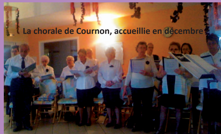
La chorale de Cournon, accueillie en décembre