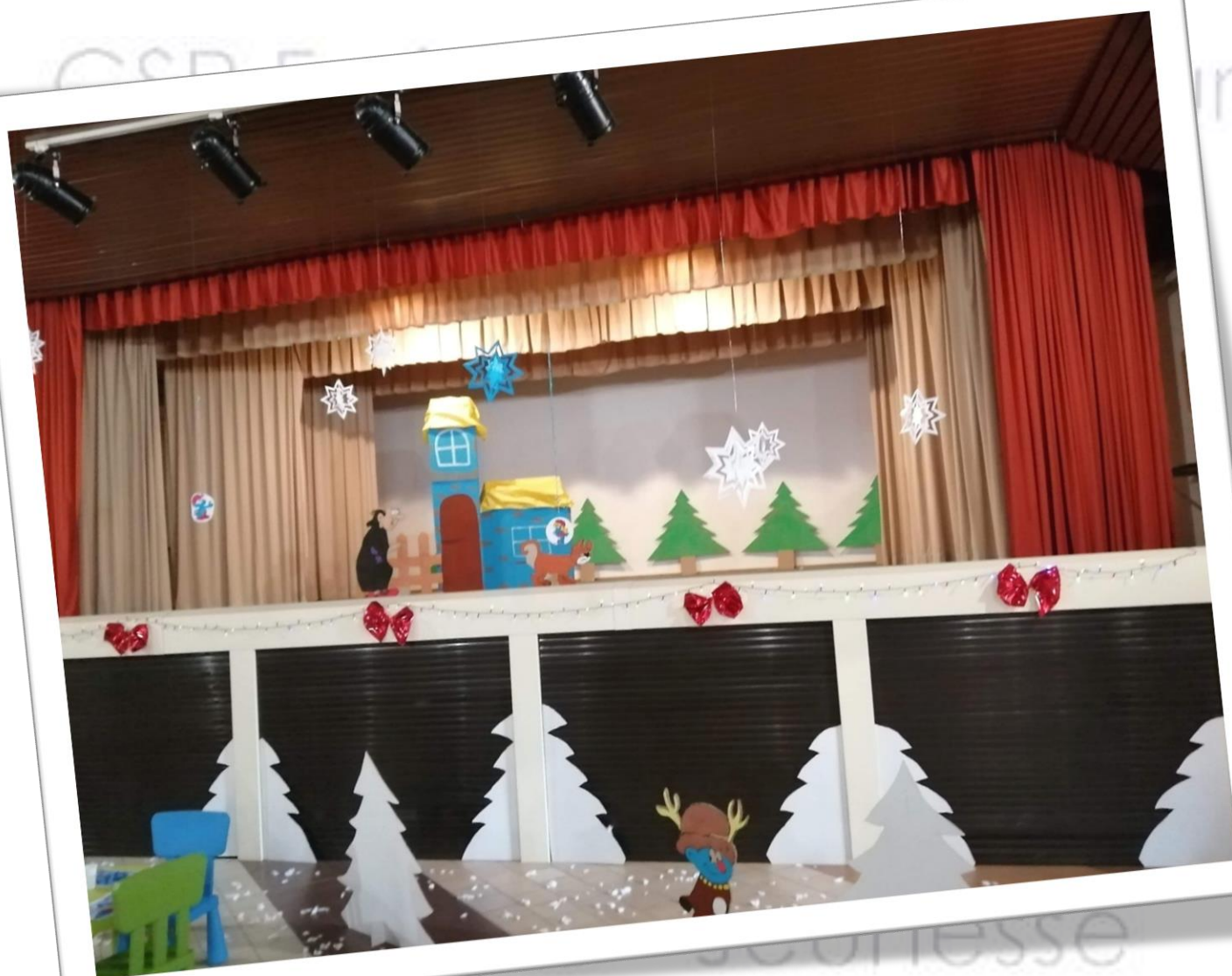
Cantine de Noyers St Martin

Ce règlement intérieur pourra faire l'objet de modifications à tout moment en cas d'évènements particuliers (crise sanitaire, sécuritaire...).