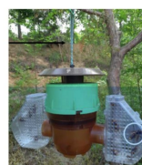
Piège coréen à ailes