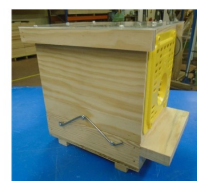
Piège à grilles Néoppi jaunes