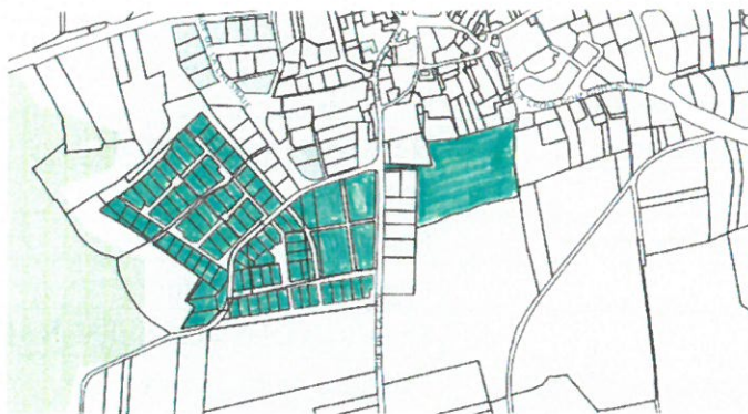
Zone 3 : Le Plessis Ouest

Zones 1 et 2 : Lotissement Les Rosais et lotissement Les jardins du Pourpris