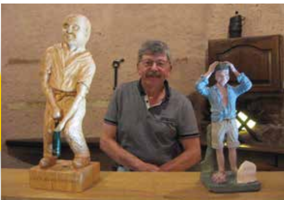
L'actualité de la pandémie a aussi inspiré l'artiste.