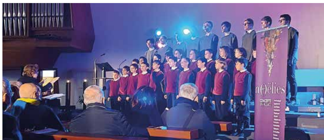
Concert du Bratislava boy's choir à Trois-Epis dans le cadre des Noëlies