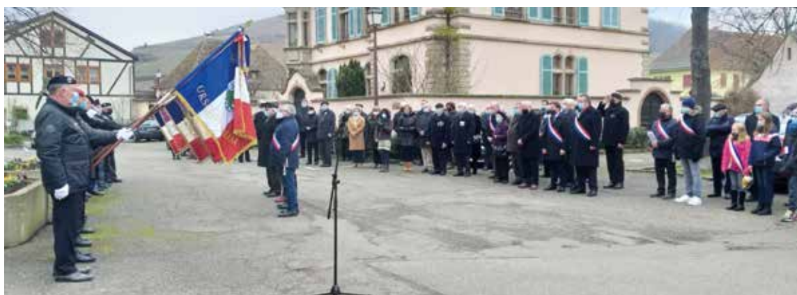
19 décembre : 77 e anniversaire de la Libération d'Ammerschwih, Kaysersberg et Kientzheim