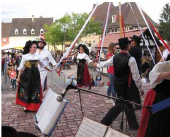
L'équipe de l'ACFA

Merci aux habitants, vacanciers, producteurs et associations d'avoir mis le « feu » à la place chaque jeudi soir ! On se retrouve, quoi qu'il arrive l'année prochaine pour une nouvelle édition ! En attendant l'été prochain, prenez soin de vous cet hiver.