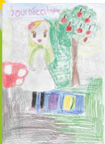
Dessin de Claire Carré