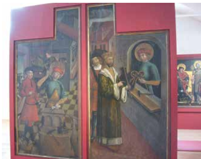
Au dos du retable deux scènes de la vie de Saint-Eloi, à gauche Saint-Eloi ferrant le sabot d'un cheval après l'avoir coupé, à droite Saint-Eloi et le roi Dagobert.