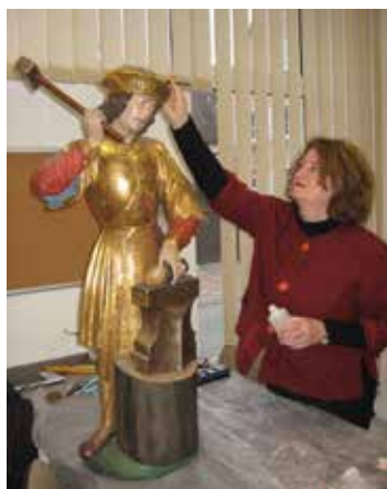
La statue de Saint-Eloi d'Ammerschwihr (ici lors des travaux de refixage des polychromies en 2017) avec sa forte ressemblance faisait sans aucun doute partie de ce retable.