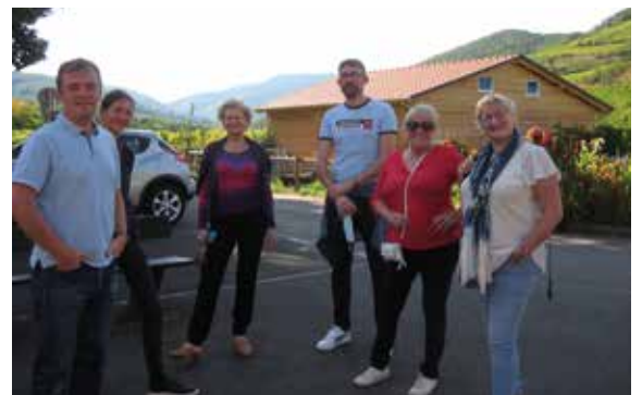
Les gardiens de la tour, conseillers municipaux, ont assuré l'accueil du public.