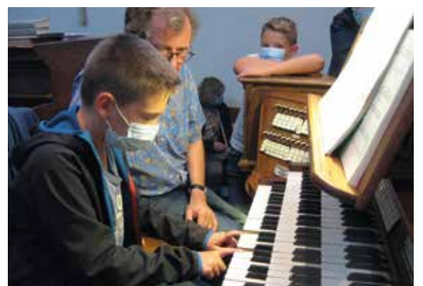
Des visiteurs ont pu s'initier aux trois registres.