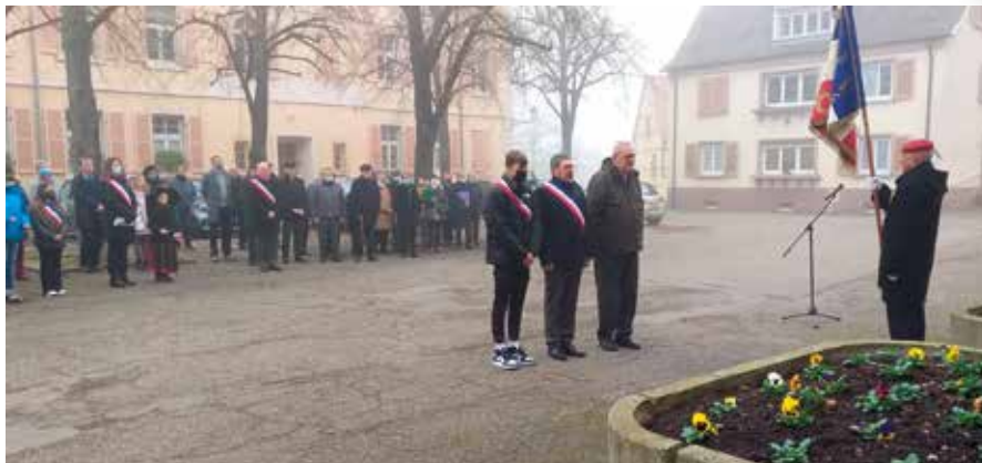
11 novembre Commémoration de l'armistice 1918