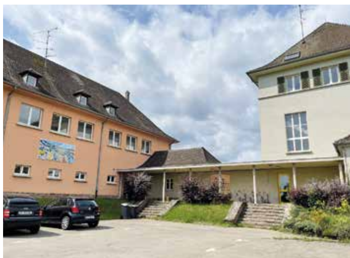
Photos avant travaux depuis le parking des enseignants.

Cette opération pourra bénéficier de subventions importantes de la part de l'Etat à travers la DETR, de la Région GRAND EST, et de la Caisse d'allocations familiales. Les travaux devraient débuter courant 2022.