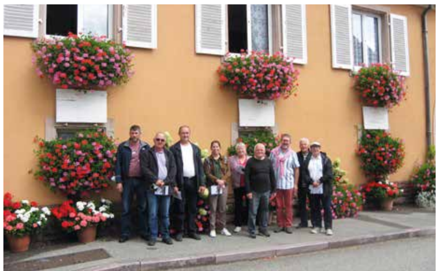
Le jury des maisons fleuries est passé le 28 août et a pu admirer de nombreuses compositions florales qui agrémentent la cité du Kaefferkopf.