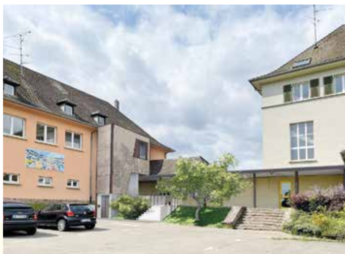
Photos après travaux depuis le parking des enseignants.