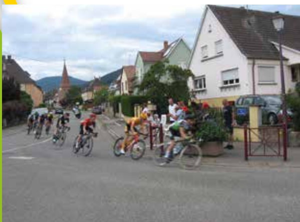
24 juillet : Tour Alsace cycliste