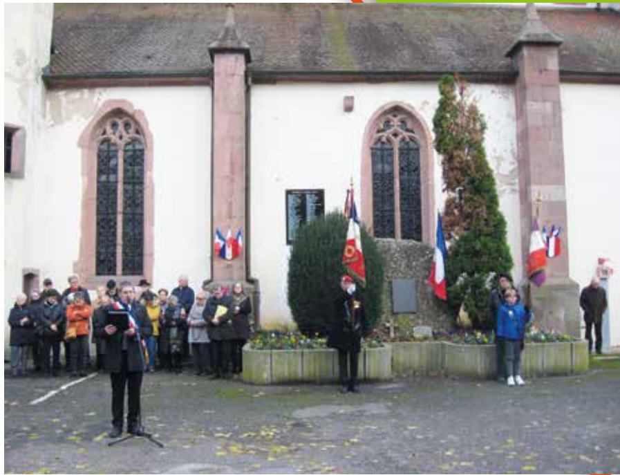
11 novembre : commémoration de l'armistice de 1918.