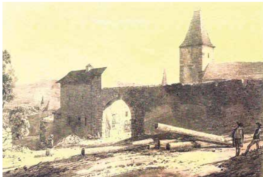
La seconde enceinte ouest (dessin de Daniel Ortlieb, 1832)

L'enceinte se poursuivait vers le sud jusqu'à une tour d'angle surmontée d'une toiture qui est toujours visible de nos jours et qui faisait 10 mètres de haut à l'époque (angle de la rue du Tir et de la RD 415). A l'arrière, à quelques mètres, s'élevait une seconde, haute de 16 mètres, avec une toiture couverte de tuiles, vestige de la première enceinte médiévale (maison Mercklé). Puis le mur se poursuivait vers l'ouest jusqu'à la petite porte de la compagnie du tir de 2,30 mètres de haut sur un