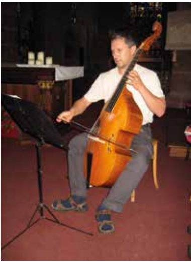
17 septembre : Journées du Patrimoine visite commentée de l'église et présentation d'instruments anciens.