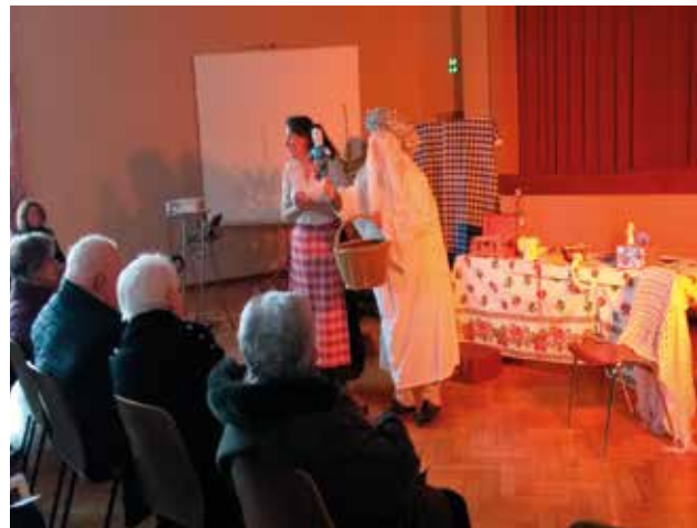
3 décembre : Spectacle de Noël pour les aînés.