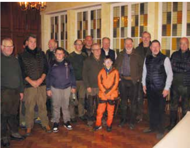
2 décembre : Réception des chasseurs en mairie.