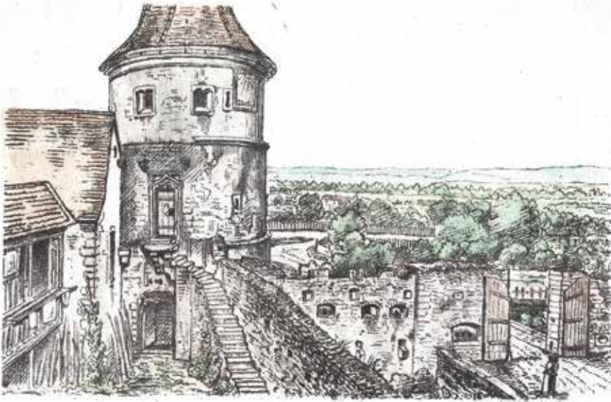
La porte basse d'après un dessin de Rothmuller

l'on pouvait descendre en cas de nécessité. En avant de cette ancienne porte à 16 toises (32 mètres) vers l'est se trouvait une autre porte extérieure, cintrée de 4 mètres de haut et 4 de large. Un pont levés en chêne permettait le passage du fossé et l'accès au vignoble. A côté de cette porte du XVI e siècle, se trouvait une autre entrée destinée au passage des piétons, d'une hauteur de 2,30 mètres sur 0,83 de large.