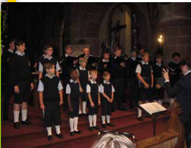
18 juillet : Concert des Petits chanteurs de Belgique.