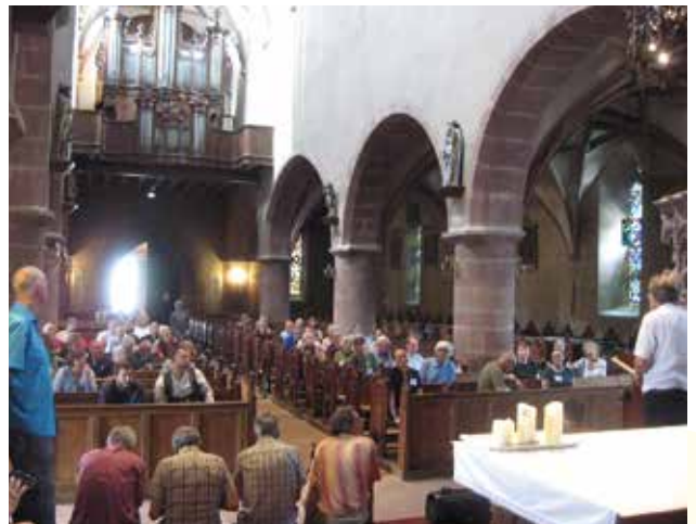
25 août : Passage du 31 ème congrès mondial des facteurs d'orgue pour découvrir l'orgue Rinckenbach d'Amerschwyr.