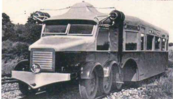
La "MICHELINE" - Le 1 er auto-rail sur pneus, créé par le PNEU MICHELIN.

prototype type 9 Michelin soit testé sur le tronçon de Saint-Arnoult à Coltainville, en dehors des heures de trafic. Il préfigure les futures michelines.