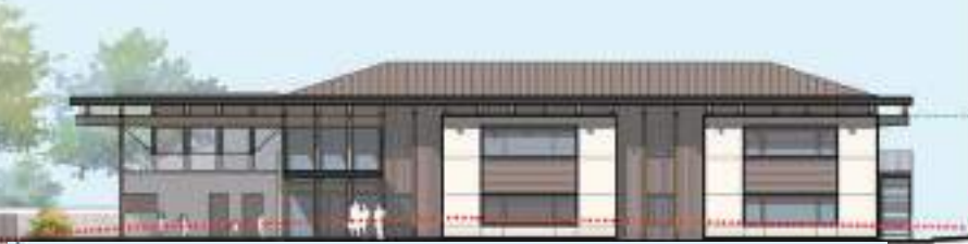
FAÇADE NORD 1:1000