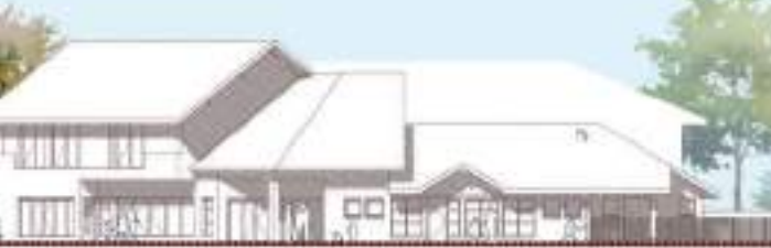
FAÇADE SUD 1:1000