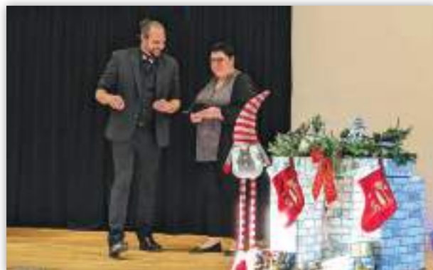
Un magicien visiblement très talentueux !