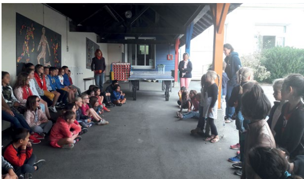
Assemblée des enfants rentrée 2019

Notre traditionnel marché de Noël ainsi que les portes-ouvertes pour les futures familles auront lieu le vendredi 6 décembre. Vous pouvez d'ores et déjà réserver votre soirée !