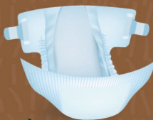
Couche 400 ans