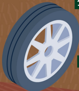
Pneu 100 ans