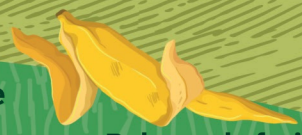
Pelures de fruits 3-6 mois