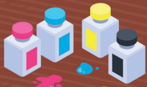
Cartouches d'encre 500 à 1 000 ans

UNE MATINÉE POUR FAIRE LA CHASSE AUX DÉCHETS