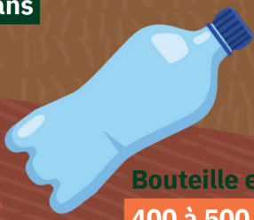
Bouteille en plastique 400 à 500 ans