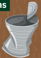
Boîte de conserve 10 à 100 ans