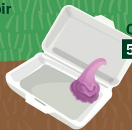
Boîte polystyrène 10 à 50 ans