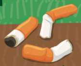
Mégots 1 à 3 ans