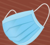
Masque chirurgical 400 à 450 ans