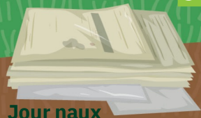
Jour naux 12 mois