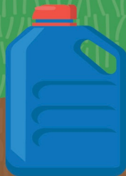
Huile de vidange 5 à 10 ans