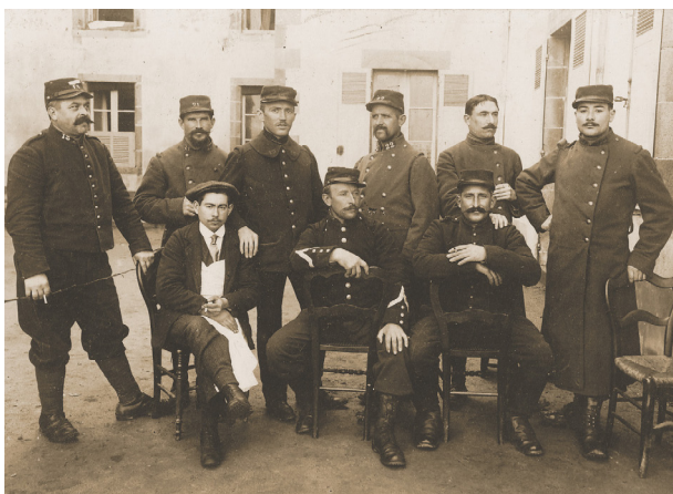
Soldats en convalescence à l'hôpital du Croisic

Quelques blessés et malades sont envoyés du Front pour se reposer au Croisic. Les deux hôpitaux sont réquisitionnés pour les accueillir: l'ancien hospice rue Jules Ferry désaffecté en 1914 et le nouvel hôpital des Lauriers, ancien orphelinat des Sœurs de Saint-Vincent-de-Paul. Des jeunes femmes s'improvisent infirmières pour soigner les soldats.