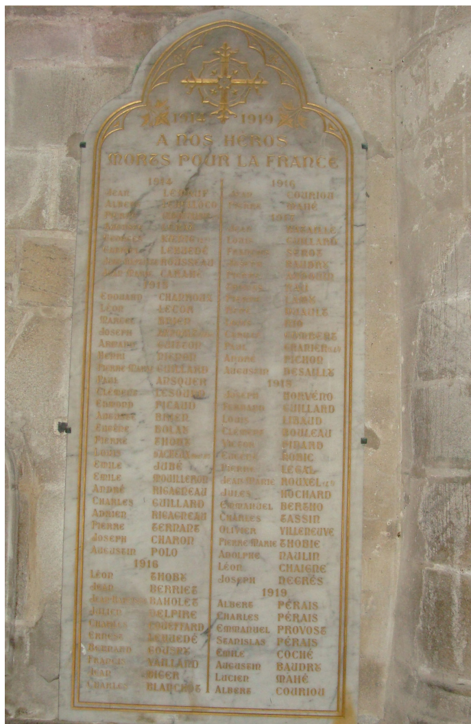
La plaque commémorative de l'église

il s'agit d'une plaque de marbre clair de forme ogivale portant la liste de 79 décédés en lettres d'or répartis par année entre 1914 et 1919 (contre 70 sur le monument communal). Elle est placée sur le mur sud près de l'autel du Rosaire.