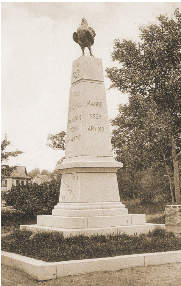
Le monument aux morts principal

Au Croisic, il y a deux monuments aux morts communaux, un au Mont-Esprit et l'autre dans le cimetière. Le premier est érigé et inauguré le 4 septembre 1921 à l'entrée du parc face au port. Il prend la forme d'un obélisque gravé de la croix de