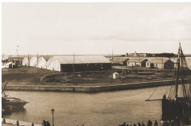
Vue partielle de la base américaine sur les jonchères.

Le 6 avril 1917, les États-Unis d'Amérique déclarent la guerre à l'Allemagne. Le président Wilson n'accepte pas la guerre sous-marine menée par les Allemands qui coule régulièrement des bateaux de commerce américains. Le débarquement s'effectuera à Brest et à Saint-Nazaire. Très vite apparaît la nécessité de protéger les convois des sous-marins allemands à l'approche des côtes françaises. Cette protection passe par la création d'unités d'hydravions et de dirigeables à proximité des ports de débarquement.