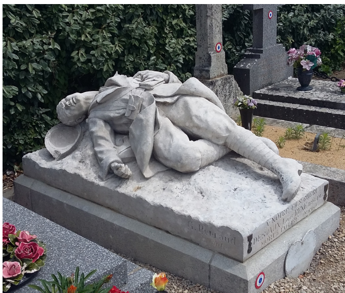
La tombe de Louis Desvaux au cimetière. Le gisant a été restauré par le comité local du Souvenir Français en 2017.

On connaît peu de choses sur ce soldat qui n'était pas Croisicais et ne figure pas sur les listes officielles locales. Sa sépulture reste toutefois l'une des plus belles et des plus émouvantes.