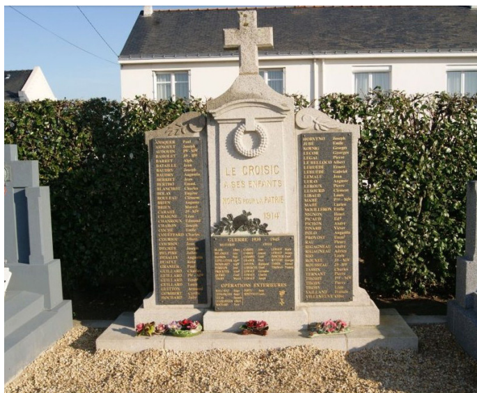
La liste inscrite sur le monument aux morts du cimetière communal