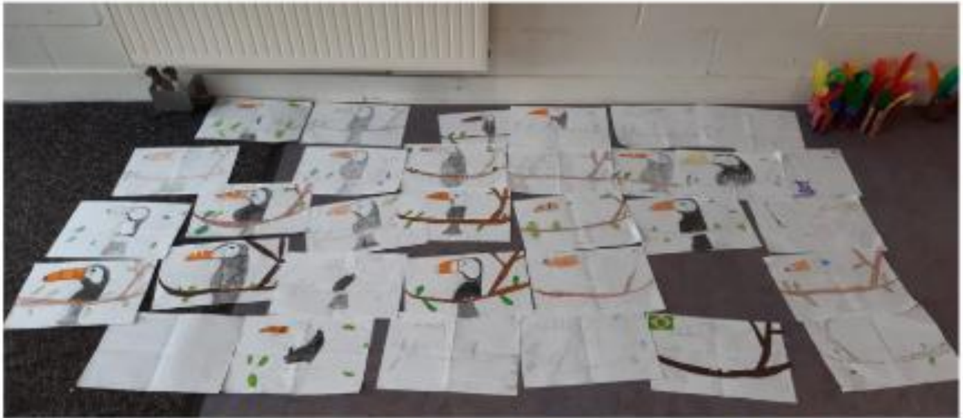
Dessins de Toucans, réalisés au centre de loisirs le mercredi 26 Février