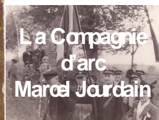
La Compagnie d'arc Marcel Jourdain