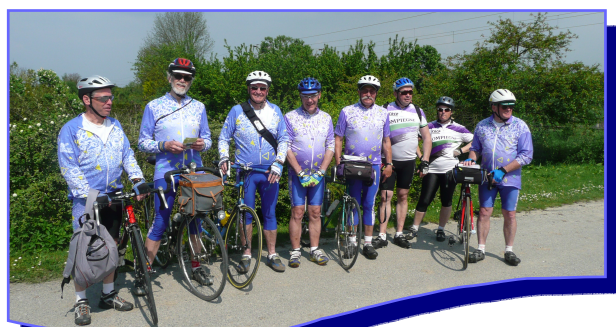
Randonnée Armancourt / Armancourt (80)

Profitez à cette occasion de ce que le club prend en charge une partie de vos dépenses concernant la sécurité (achat d'un casque, mise en conformité de l'éclairage etc.).