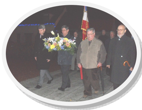
Remise de la gerbe au monument aux Morts

La dernière manifestation de l'année à laquelle a participé l'Amicale des Anciens Combattants de Jaux et d'Armancourt s'est déroulée le 5 décembre dernier pour commémorer la guerre d'Algérie en présence des représentants des associations d'Armancourt, des membres du Conseil Municipal et du Conseiller Général.