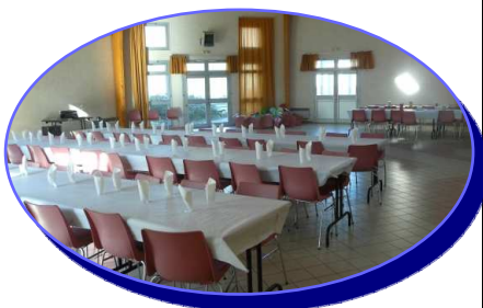
La salle polyvalente

Vous souhaitez partager une soirée entre amis, un repas de famille, fête un mariage, la Municipalité peut vous louer la salle polyvalente de notre village à un prix préférentiel pour les Armancourtois.