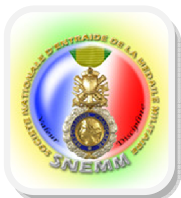
Sigle de la Société Nationale

La Médaille Militaire reconnaissable à son ruban vert et jaune a plus de 150 ans, elle est née de la volonté du Prince Louis-Napoléon le 22 janvier 1852 peu avant l'avènement du Second Empire.