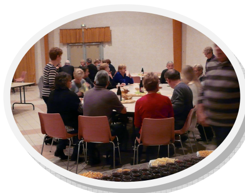
Soirée Beaujolais à la salle