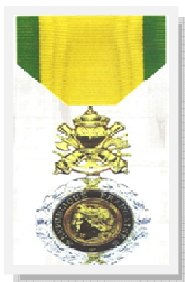
La médaille militaire