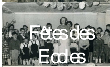
Fêtes des Ecoles