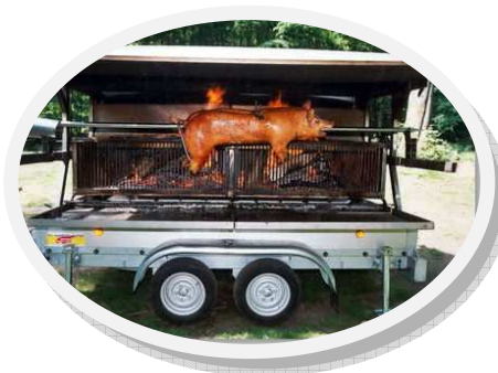
Repas champêtre autour du cochon