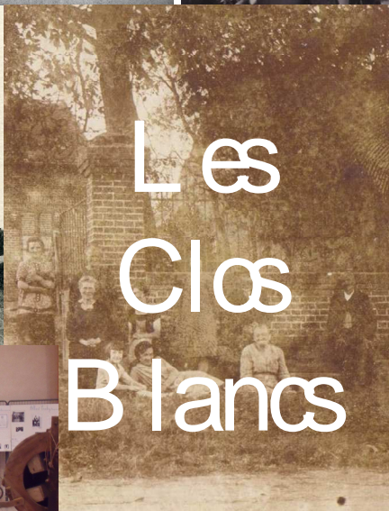
Les Cloes Blancs