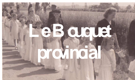
Le Baquet provincial

Les enfants de l'école sont également venus voir le lundi cette exposition, mesurant les différences entre l'école d'autrefois et celle d'aujourd'hui, et les fêtes qui étaient organisées.