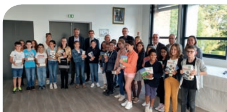
■ Remise des dictionnaires, le 4 septembre