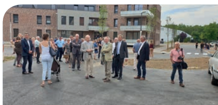
■ Inauguration des Terrasses du Long Champ, le 5 juillet