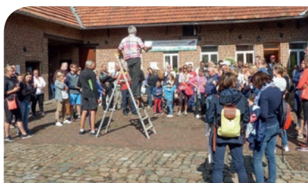
■ Balade à vélo, le 8 septembre