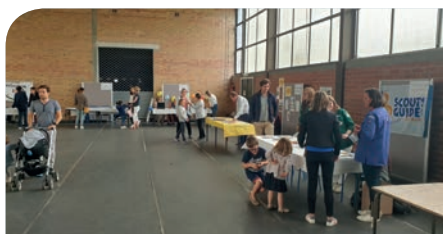
■ Forum des associations, le 6 septembre