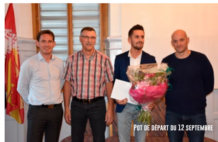
POT DE DÉPART DU 12 SEPTEMBRE

Ce fût un plaisir de collaborer avec l'ensemble du personnel communal afin de rendre un service public efficace dans l'intérêt des Wattwilleroises et Wattwillerois. Les fonctions de secrétaire général de Mairie sont passionnantes mais pas de tout repos ! Elles permettent notamment de mettre en musique les décisions collectives de l'équipe municipale. J'ai une pensée particulière pour toutes les forces vives qui animent et font de Wattwiller une commune agréable à vivre. Merci à tous.»