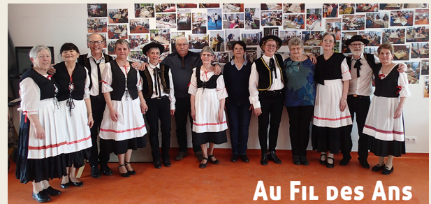
Au Fil des Ans

À l'occasion des anniversaires du premier trimestre pour nos chers résidents de l'EH PAD de La Ferté-Milon, et en plus des cadeaux distribués, nous avons convié en mars un groupe de danses folkloriques d'Anizy-le-Château, qui a pu démontrer ses talents joyeux et variés.