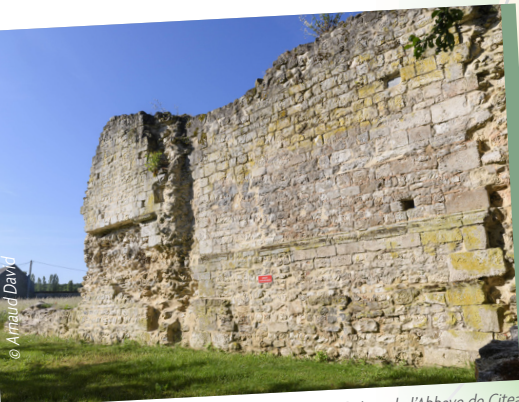
Ruines de l'Abbaye de Citeaux