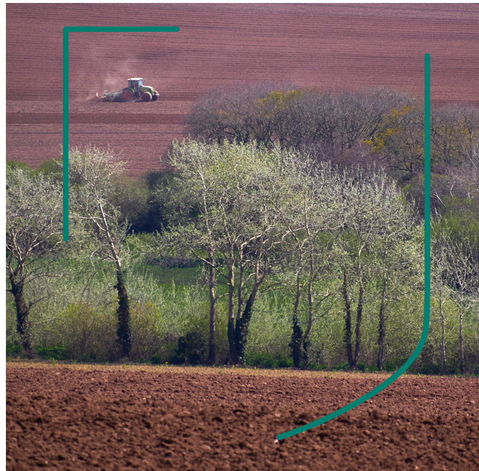
Département du Finistère - Source carto : ©IGN, BD, CARTO, DRAAF, DDTM - Recensement agricole 2020 - Crédits photos: Chambre d'agriculture - Illustration: G&H Zales - Mars 2025