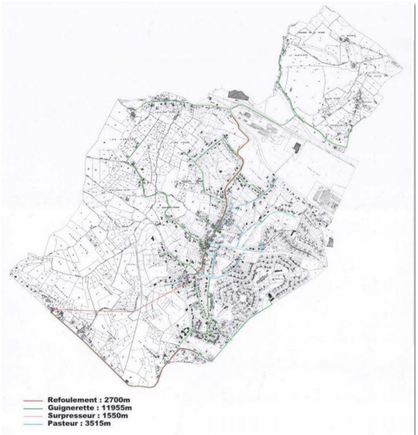
Carte réseau adduction eau potable 2010 ST Benoit

Il n'existe pas de captage sur le territoire communal, par conséquent, la commune n'est pas concernée par l'établissement de périmètre de protection. Tous les quartiers de la commune de St Benoît sont desservis par le réseau d'eau potable géré par la régie municipale, excepté sur les quartiers précédemment cités, pris en charge par Néolia.