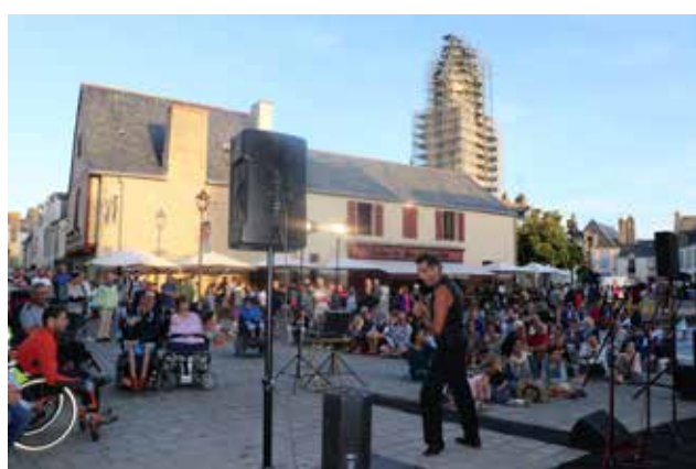
Concert Ukestock - 15 juillet 2019