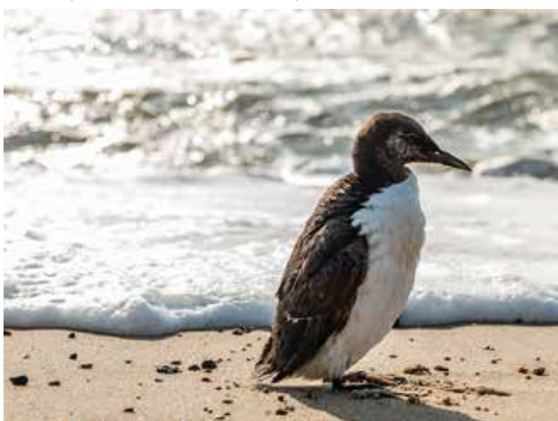
Guillemot de Troil