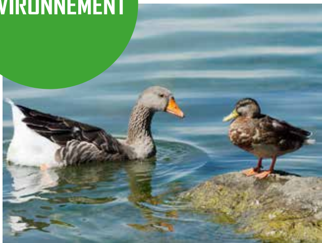
Anatidés (familles des oies et des canards)