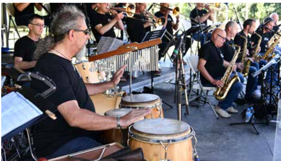
Le groupe Initial Big Band en concert au Mont-Esprit