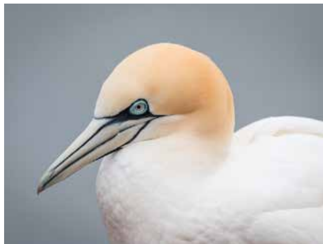
Fou de Bassan