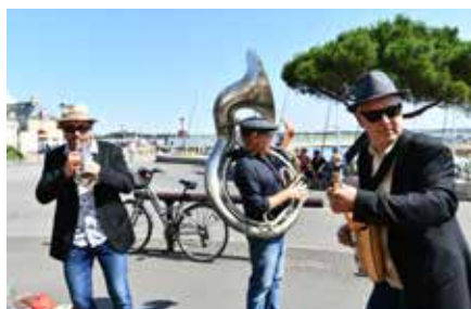
River Swing en déambulation sur le port