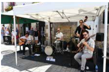
Gadjo & Co, place du Piloni