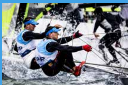
2017 World Cup Series, Hyères, France