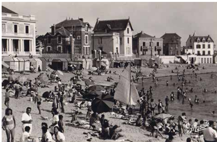
Port-Lin, la plage emblématique du Croisic dans les années 1950.

Supplément vélo (paniers et sacoches enlevés): 1 €.