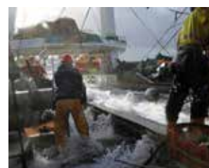
Bateau de pêche