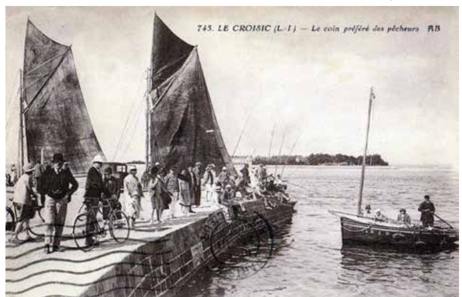
Touristes sur le port, vers 1920.