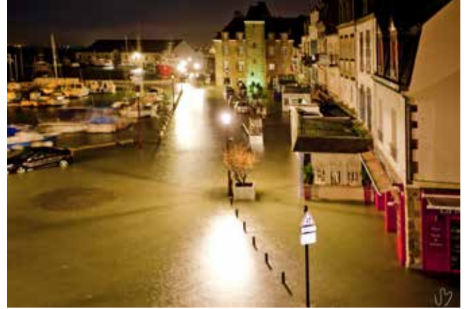
Tempête Xynthia au Croisic, dans la nuit du 27 au 28 février 2010.