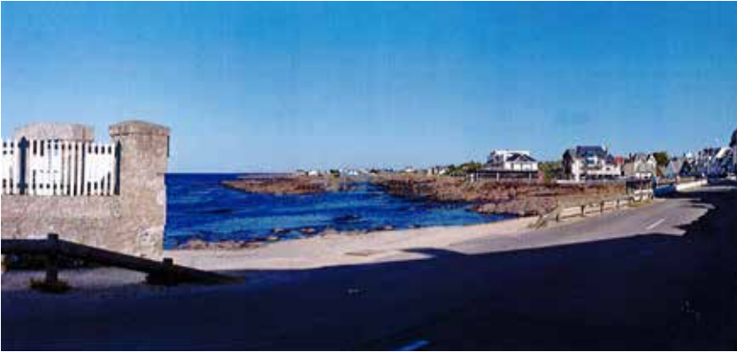
Port-Lin va être réhabilité. L'idée est de rendre de la visibilité sur la plage en effaçant le muret actuel.

Toutes ces interventions sur notre patrimoine bâti, nous obligent à des relocalisations temporaires. Et c'est pourquoi je sais pouvoir compter sur la compréhension des principaux utilisateurs, à savoir les associations.