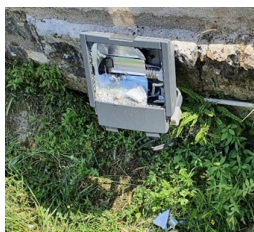
Office du tourisme à 2 reprises

public (rue de la gare, office du tourisme – place Pierre Genevée à 2 reprises) et l'aire de jeux nouvellement rénovée (impasse du Mail) à 2 reprises.