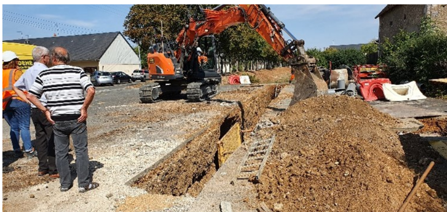
Parking école maternelle - rue du Mail

Des entrées d'eaux claires sur le réseau des eaux usées engendrent une surcharge hydraulique sur la station d'épuration existante. La réhabilitation des réseaux de collecte devenait nécessaire. Elle concerne la rue Auguste Moreau et en fond de