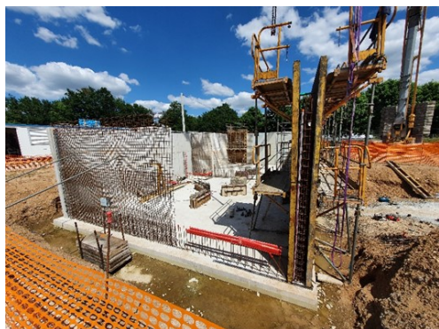
Clarificateur et bassin d'aération

L'engagement de l'État, de l'Agence de l'Eau Loire Bretagne et du Conseil départemental est déterminant pour assurer l'équilibre budgétaire de cette opération indispensable pour le futur développement urbanistique de la commune.