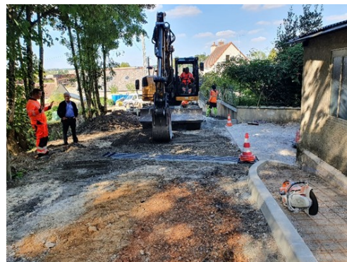
Impasse de la Tour

Sur 2021, le coût s'est élevé à 30 834,10 € HT soit 37 000,92 € TTC et 20 025 € HT soit 24 030 € TTC pour 2022.