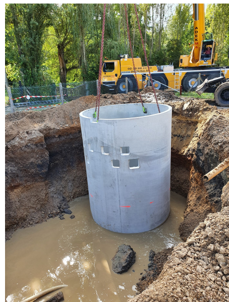
Poste de refoulement