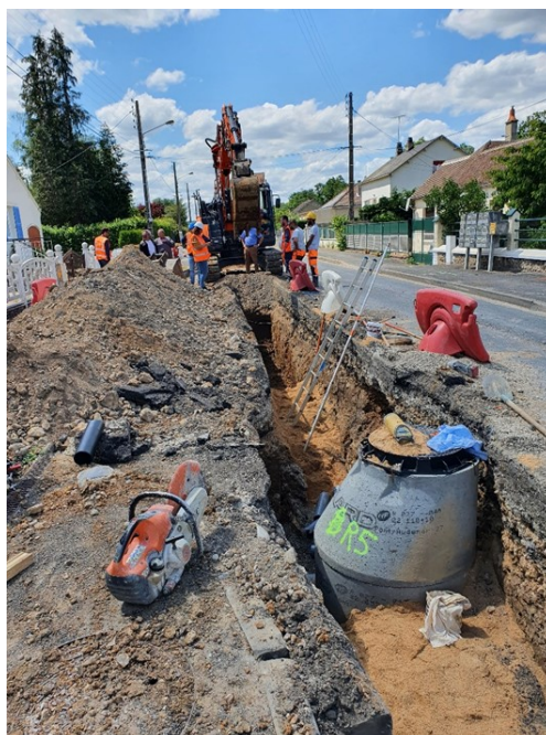
Rue Auguste Moreau

Le réseau de transfert de la station actuelle vers la nouvelle station est construit. Il restera à assurer la mise en œuvre du poste de refoulement récemment implanté sur le périmètre de la station en service et le raccordement à la nouvelle station.