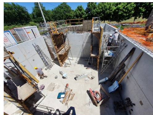
Clarificateur et bassin d'aération

Les travaux sont conduits par les entreprises OTV, Val du Cher BTP avec les sous-traitants Minier et Pinto.