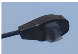
Rue de la Gare

Pour terminer mes propos, je veux porter à votre connaissance le fait que les équipements communaux font l'objet d'actes de vandalisme.