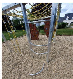
Aire de jeux

Le coût global depuis janvier 2021 s'élève à 19 361,02€ TTC.