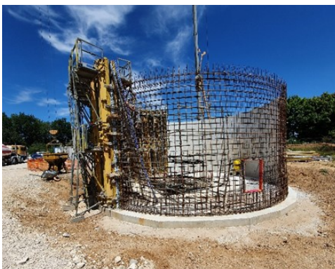
Silo à boues

Ces opérations ont été confiées à l'entreprise DEHE Centre Val de Loire pour un coût global de 351 447,50 € HT soit 421 737 € TTC.