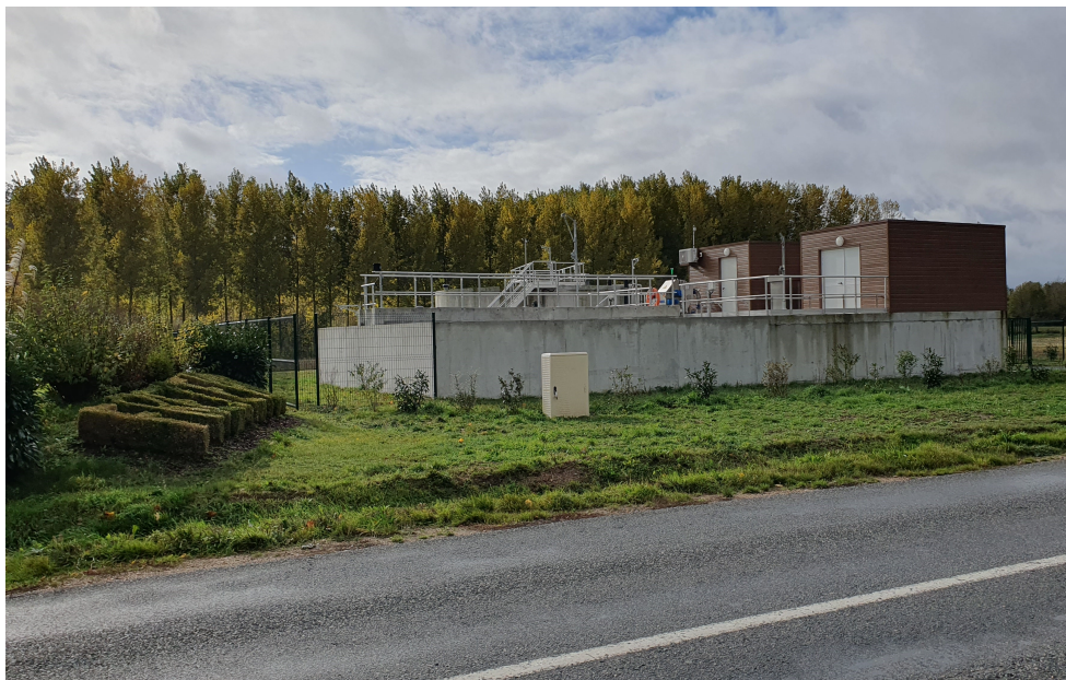
Nouvelle station d'épuration de Fréteval

Après le premier coup de pelle donné en février 2022, la nouvelle station d'épuration a été mise en service le 20 mars 2023. Elle est actuellement en phase d'essais et d'analyses jusqu'au mois de décembre 2023. Le montant initial des travaux s'élevait à 1 294 340 € HT. L'actualisation a augmenté le coût global de 5.67% (représentant 73 398,89 €). Une deuxième demande de DSR (Dotation de Solidarité Rurale) auprès du département a été faite afin de compenser cette hausse.