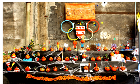
Concours de citrouilles 2023

Le premier clin d'œil aux JO fut le concours de citrouilles lors du marché artisanal de Fréteval le dimanche 15 octobre 2023. Le thème était « Les Monstres aux JEUX OLYMPIQUES ». Les participants ont fait preuve d'ingéniosité malgré un thème difficile à mettre en œuvre.