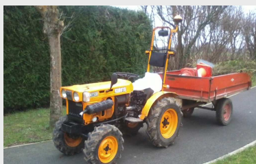
Le tracteur après rénovation

Nous avons fait l'acquisition d'une balayeuse qui ramasse les déchets. Grâce à un balai en fer, nous pouvons nettoyer les zones difficiles et désherber la voirie sans utiliser des produits chimiques. Cette dernière action favorise la préservation de nos ressources en eau et notre écosystème. Cet investissement financé à 62% par l'Agence de l'eau, le Conseil Régional et l'Agglomération de la Région de Compiègne nous permet d'être indépendant, d'entretenir régulièrement nos voiries, d'être réactif en cas d'incident et de maintenir un village propre.