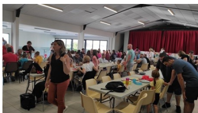
L'équipe de l'APEFLO

Nous vous souhaitons à tous de bonnes vacances bien méritées.