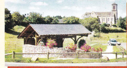
Le lavoir de Tournebride

6 Prudence , traverser la D 25 Flers-Mortain dans l'axe, en direction de « La Rivière » ; 50 m après, virer à gauche pour atteindre la route Beauchêne-Lonlay-L'Abbaye. Tourner à gauche pour rejoindre le point de départ.