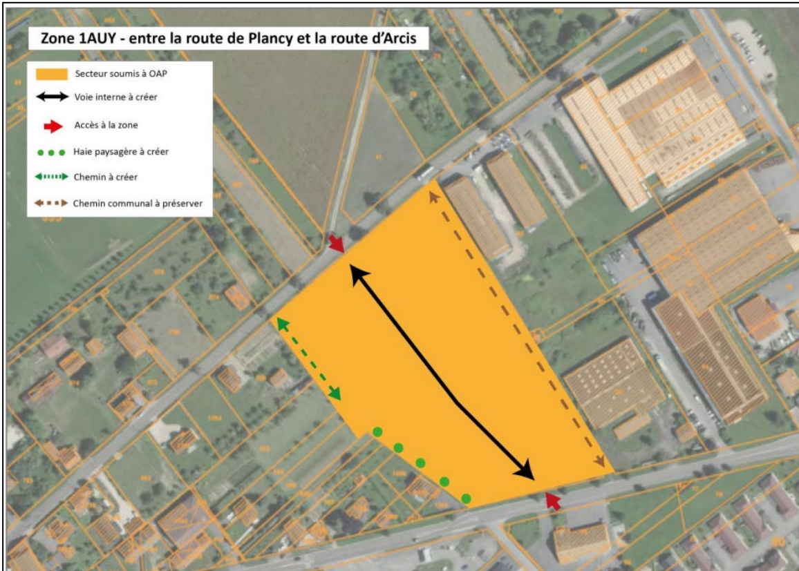
Schéma de l'OAP après modification n° 1 :