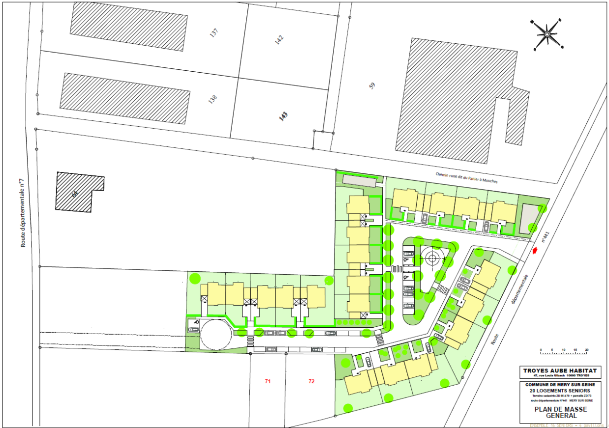
Plan de masse du projet

Les parcelles ZD 65, 66, 67, 68, 70 et 73 concernées par le projet de logements seniors sont reclassées en zone 1AU du PLU pour une surface totale de 1,05 ha.