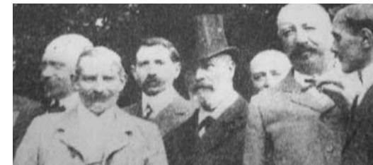
Le Pr Pinard avec son célèbre chapeau Haut-de-forme et quelques membres de son conseil municipal en 1903

Pinard ? Un promoteur du Beaujolais nouveau, un adepte du vin, pour notre chair à canon des tranchées ?