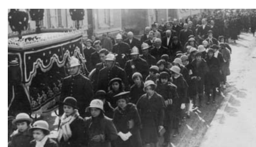
Obsèques du professeur Adolphe Pinard le 1er mars 1934

Sources : Archives municipales - Famille Delescluse, à Méry/Seine - Wikipedia