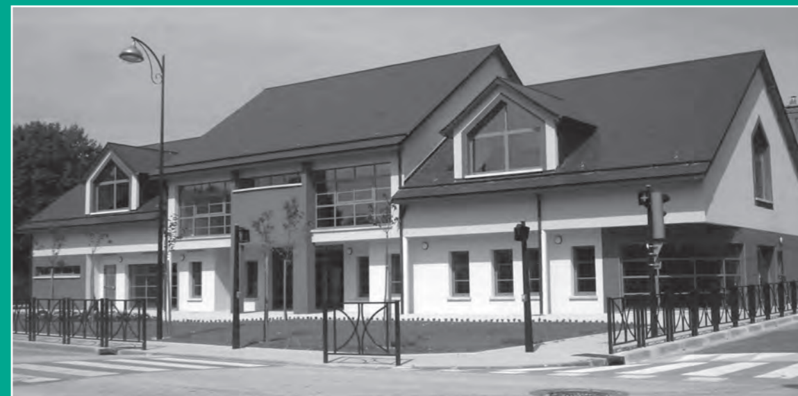
Nouveau Bâtiment Socioculturel