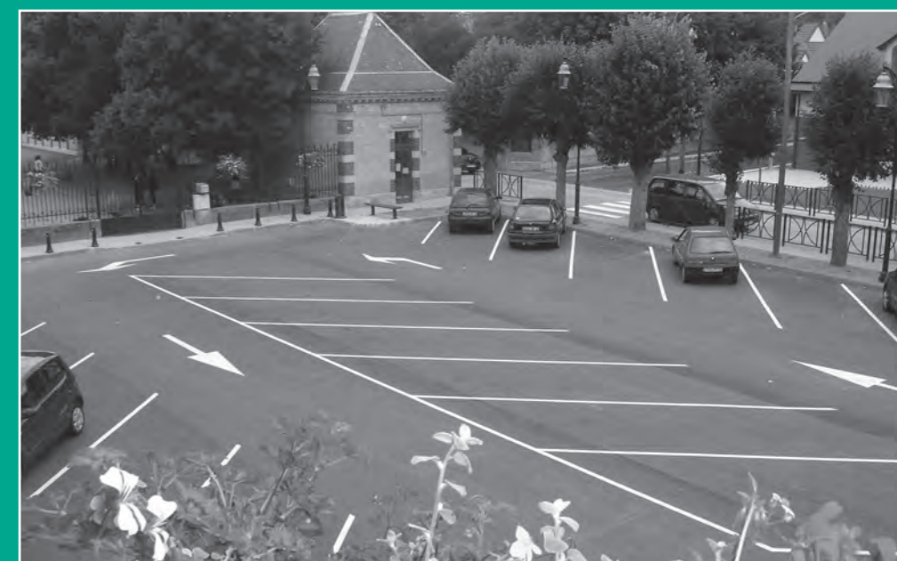
Le parking place du 14 juillet