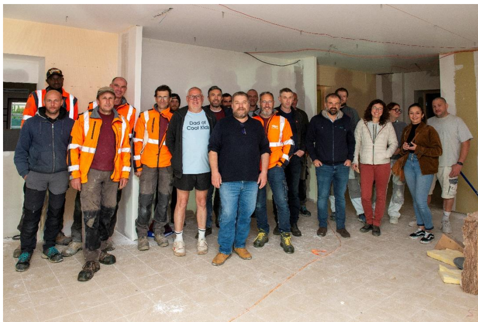
Moment convivial avec les entreprises, l'Agence Maurin Architecte, M. le Maire et les élus

A la rentrée, une visite de chantier sera proposée aux parents d'élèves le mardi 2 septembre de 16h30 à 17h30, puis de 17h30 à 20h pour toute la population.