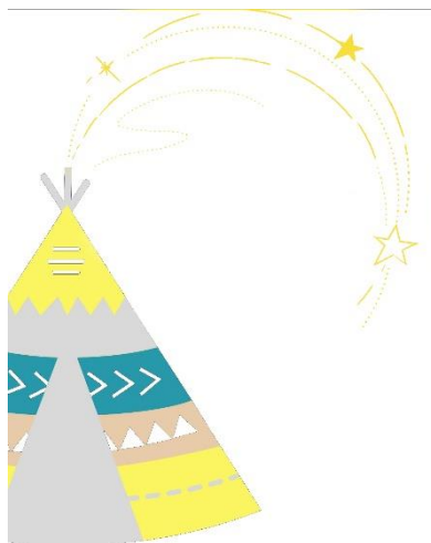
Accueil de loisirs de Saint-Christo-en-Jarez

Dans le cadre de l'intercommunalité, la commune de Fontanès a signé une convention avec l'association Familles Rurales Saint-Christo-en-Jarez / Valfleury pour le centre de loisirs. Les familles domiciliées sur la commune sont désormais prioritaires pour l'inscription des enfants au sein de l'accueil de loisirs.