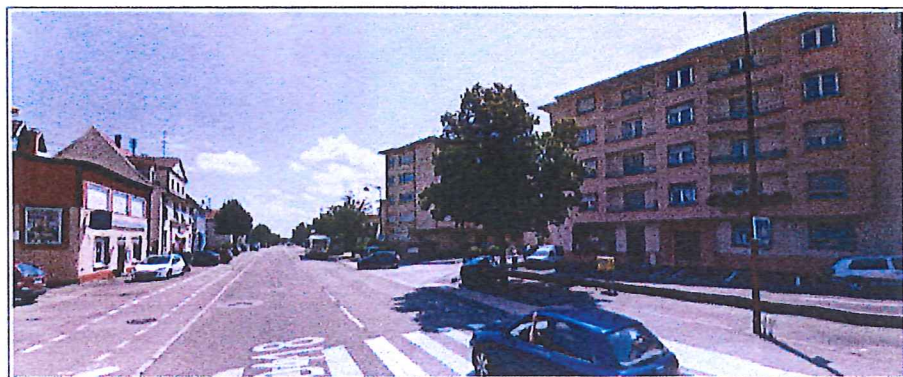
Vue sur le n° 113 route de Colmar à Ingersheim, en direction de Colmar.