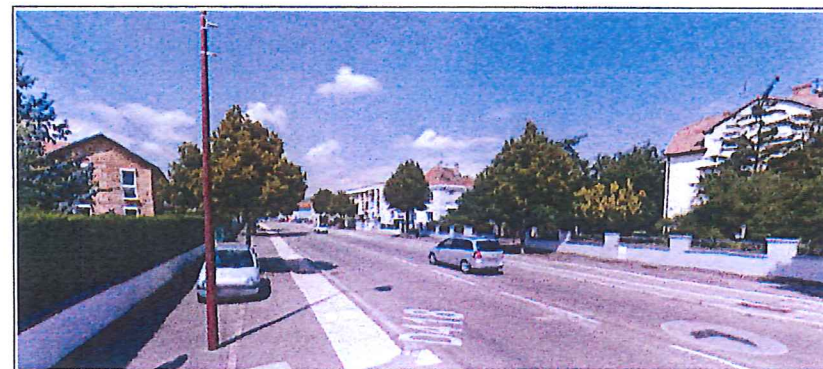
Vue sur la route de Colmar, en direction d'Ingersheim, à l'angle de la rue Charles Grad.