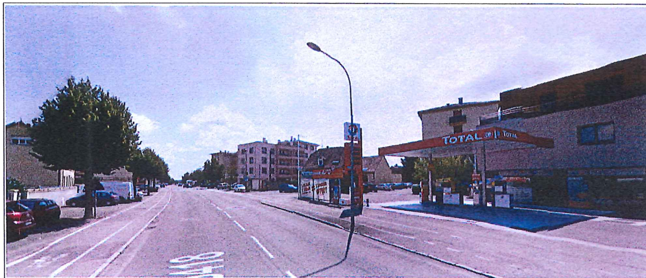
Vue sur la route de Colmar, qui relie Ingersheim à Colmar, en venant du rond-point (lequel se trouve à l'arrière de la photo).

Dans le cas présent, les lieux situés dans la SUP « résiduelle » ne présentent aucun caractère patrimonial susceptible de mettre en valeur les monuments historiques précités (voir photos ci-dessous).