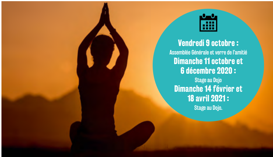
Le yoga, un bienfait pour le corps et le mental

Quel que soit l'âge, quelle que soit la condition physique, le yoga décline ses « Asanas » ou postures traditionnelles apportant ses bienfaits sur le corps et le mental, aidant à mieux maîtriser ses émotions.