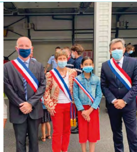
Le CMJ, chez les pompiers le 14 juillet