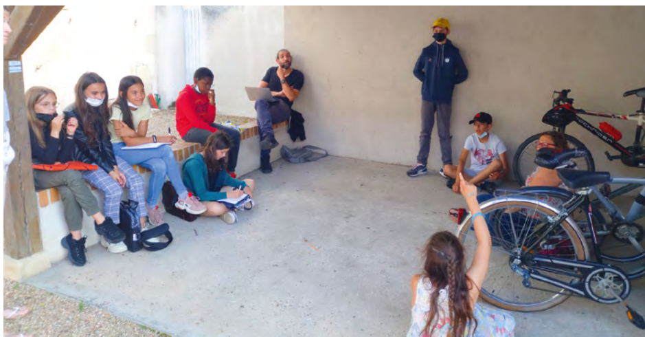
Réunion du Conseil Municipal Jeune

Maintenant, place à la 2 de année. Une partie des enfants vont au collège. Nous prendrons en compte ces impératifs pour planifier les réunions en conséquence et en évitant les horaires trop matinaux ! Des projets sont en vue (visite conseil départemental et assemblée nationale, partage de notre expérience avec les villages alentours et envisager une réunion inter-villages de nos CMJ). ▀