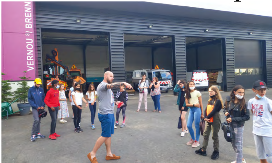
Visite des ateliers municipaux

C'est avec une grande joie et fierté que nous nous sommes réunis début juillet pour clôturer cette première demi-année et en faire le bilan. Les enfants sont enthousiastes et se sentent écoutés et toujours dans l'échange avec les adultes.