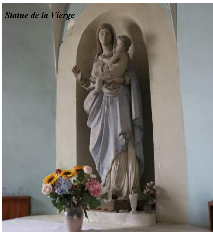
Statue de la Vierge