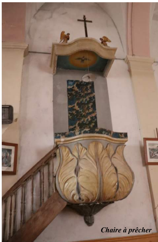
Chaire à prêcher