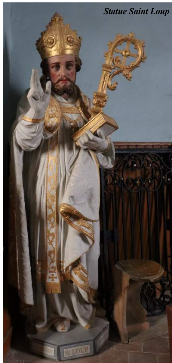
Statue Saint Loup