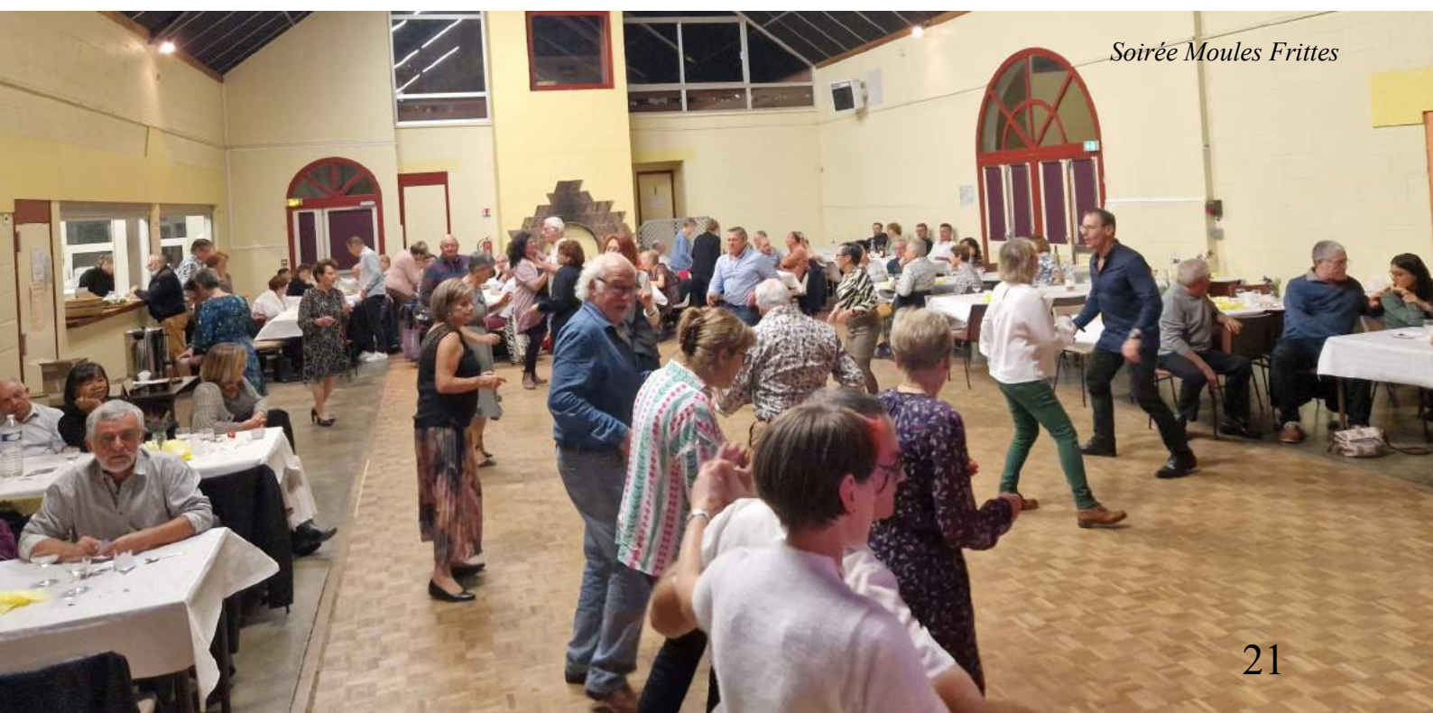
Soirée Moules Frites

Nous contacter : 06 68 13 25 10 / email : foyer-rural.vignoux-sous-les-aix@laposte.net