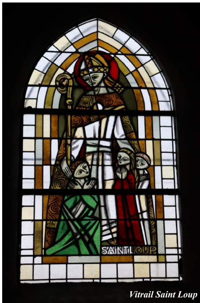
Vitrail Saint Loup