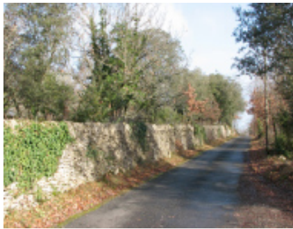
Mur de pierres sèches

Départ du parking randonneurs à la Croix Blanche.