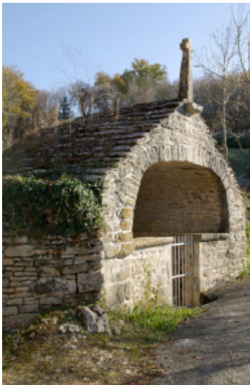
La chapelle de Notre Dame