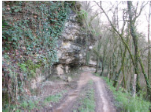
Le chemin du Lombard