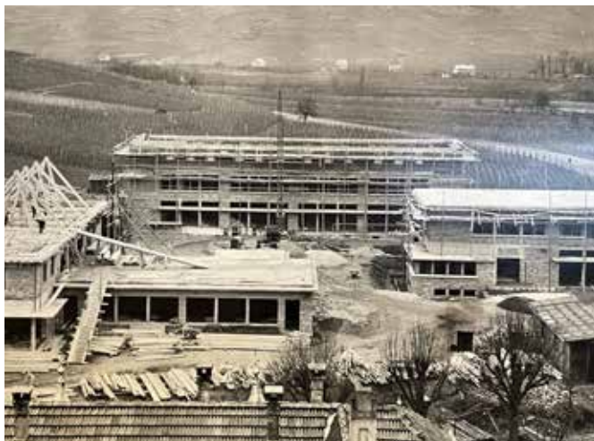
Construction de la nouvelle école, inaugurée le 26 octobre 1952

Ils ont également pu apprécier le film de Miss Thérèse BONNEY qui a été nommée citoyenne d'honneur d'Ammerschwihr en 1945 en reconnaissance de son action pour la reconstruction du village. Cette journaliste-reporter de guerre américaine a apporté son soutien moral et aide matérielle à la population sinistrée après les bombardements de décembre 1944.