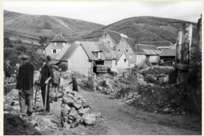
Le déblaiement du village

Les témoignages ont été recueillis lors du « Stammtisch » qui s'est tenu au restaurant du Caveau le 18 janvier 2009.