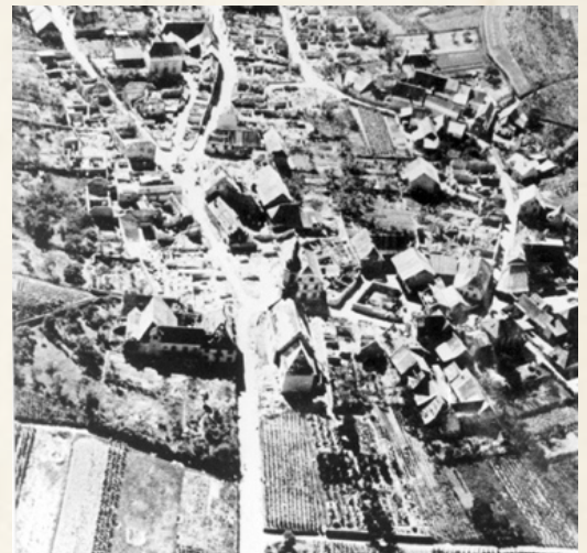
Le village détruit

« Dans la nuit du 8 décembre, tout à coup, mes parents nous ont réveillé. Debout, il faut aller dans la cave. On nous a enroulés dans des couvertures, moi, j'étais le plus jeune, mes sœurs plus âgées. On est descendu dans la cave. Des obus ont passé notre maison et tapé dans le cimetière et derrière vers le « Neibari ». Tout à coup, un grand fracas, de la poussière partout, des cris. Un des premiers obus a tapé la maison côté terrasse. C'était un premier tir sur Katzenthal.