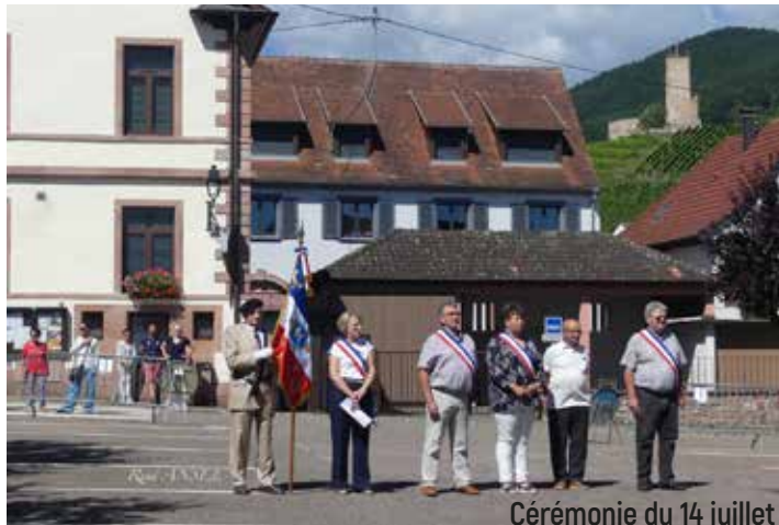
Cérémonie du 14 juillet

• Mardi 30 janvier : réunion du Comité - Préparation de l'assemblée générale.