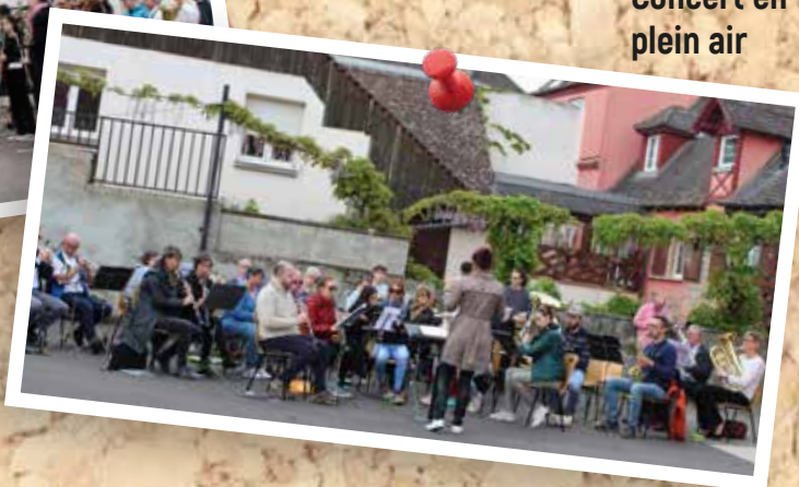
8 mai : Concert en plein air