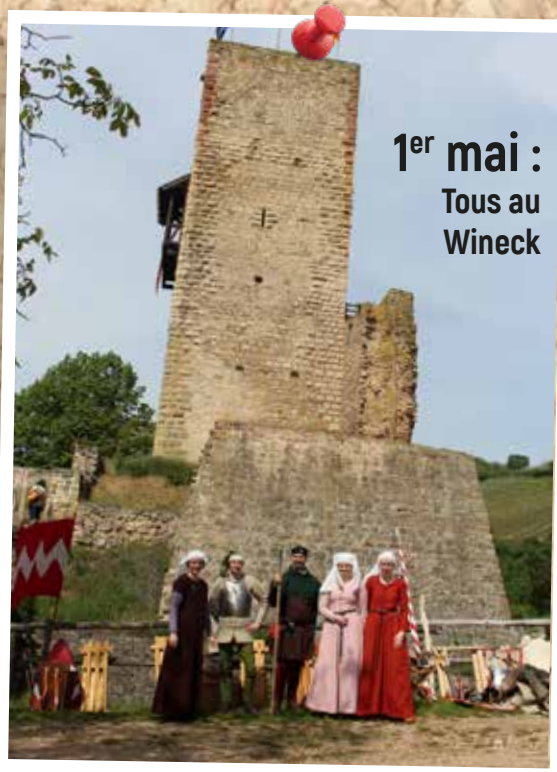
1 er mai : Tous au Wineck