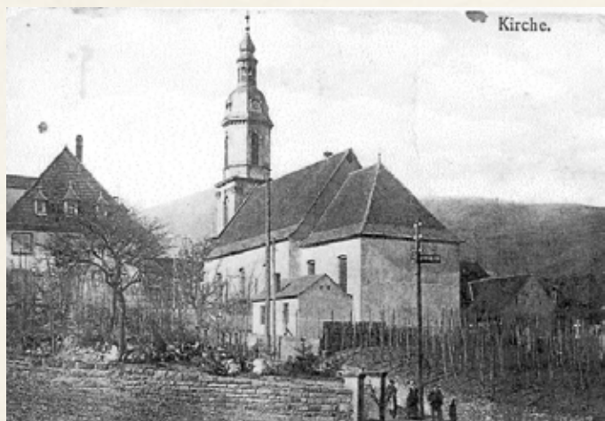
L'église avant guerre