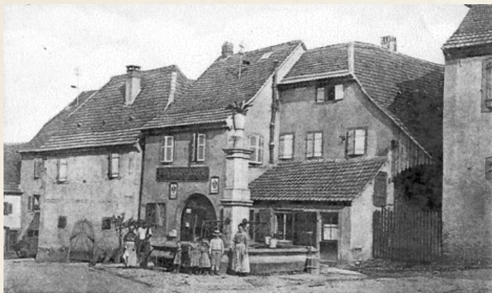
La fontaine avant la guerre