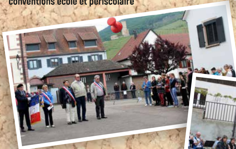
8 mai : Commémoration de la fin de la Seconde Guerre Mondiale