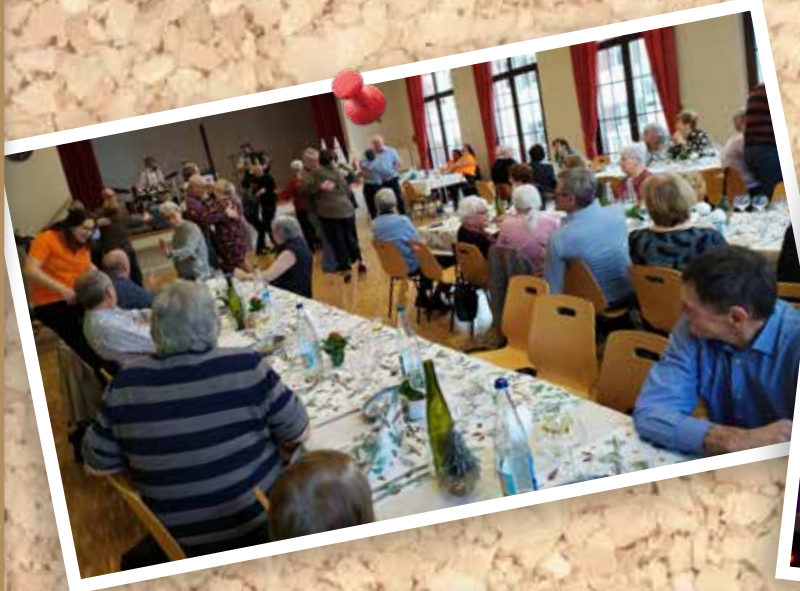
11 février : Fête des aînés