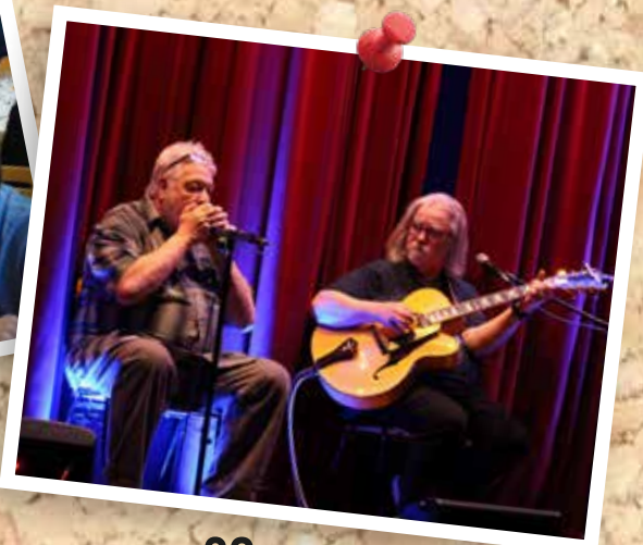
20 mars : Festiblues concert de jazz