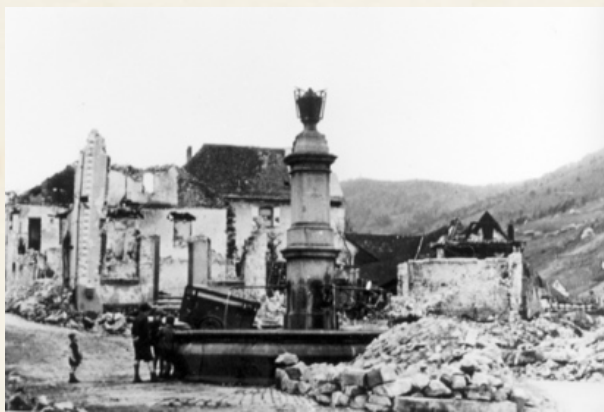
La même fontaine à l'issue de la guerre