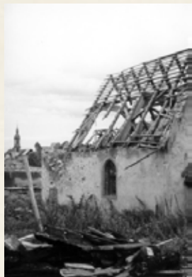
La chapelle rue Hasengass (Rue du Vignoble)