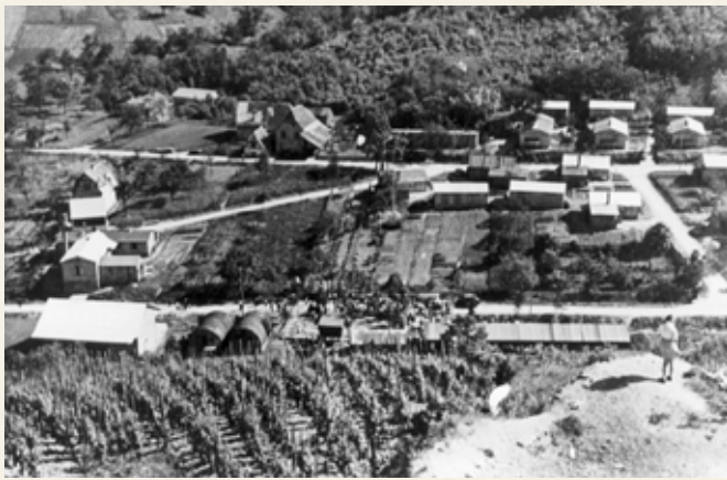
Le village provisoire