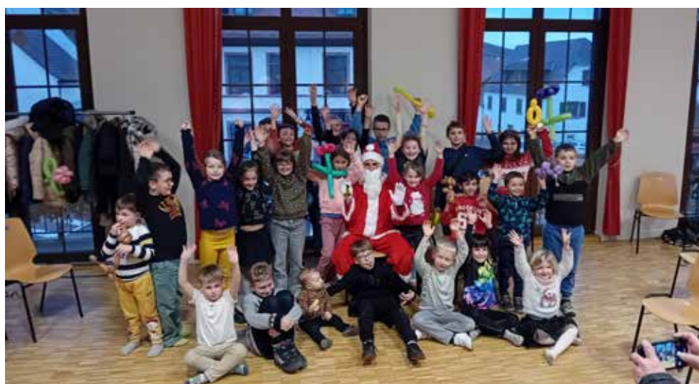
Fête de Noël