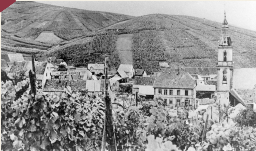
Vue d'ensemble du village avec la mairie

La bataille de la Poche de Colmar au cœur de l'hiver 1944/45 débute le 4 décembre à Katzenthal avec l'arrivée de 4 canons dans le village. Les conséquences vont être effroyables, le village est reconnu sinistré à 100% comme en témoignent les photos prises rue par rue et maison par maison, qui seront exposées le 2 février à la salle communale.