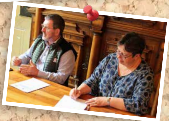
12 avril : Signature des nouvelles conventions école et périscolaire