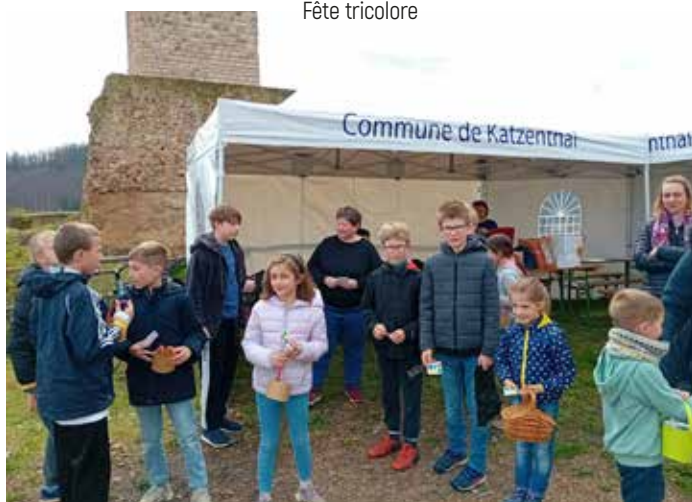
Chasse aux œufs