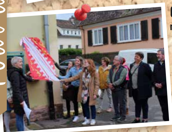
6 mai : École maternelle «Elysée»