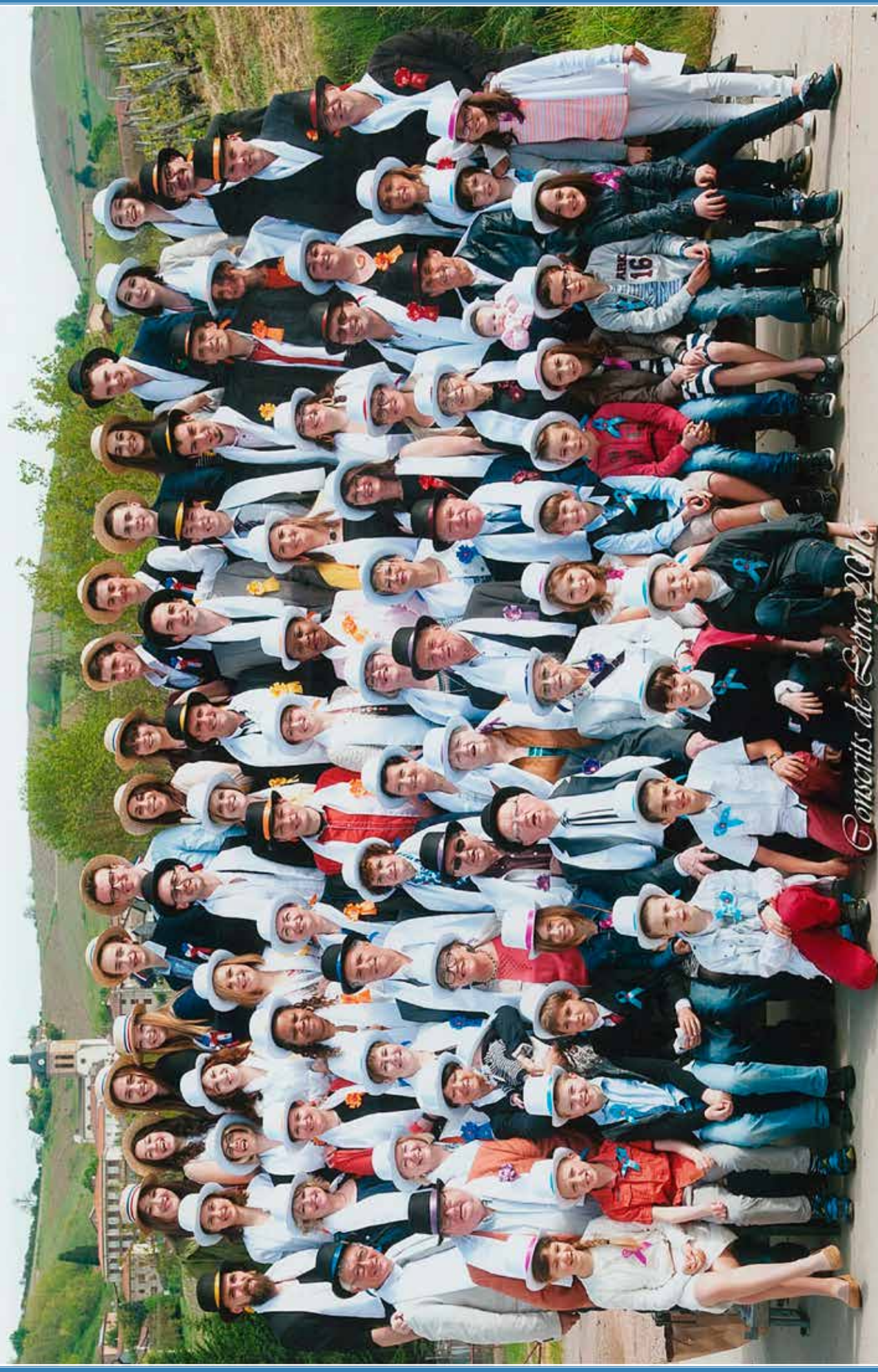
Concerts de Léna 2016