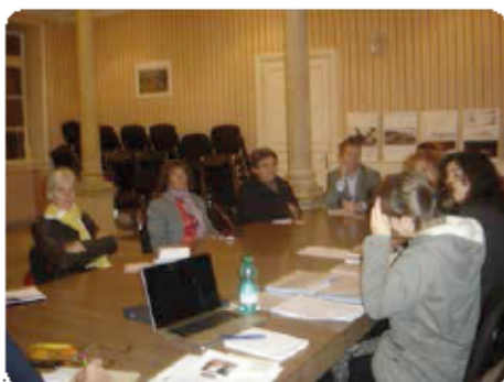
Fig. 1: le conseil d'administration en pleine réunion

Pour cela, ils créent en juin 2015 une association pour faire entendre leur voix et pour demander que cette ligne devienne réellement attractive pour les bassins de vie qu'elle traverse : Charolais-Brionnais et Vallée de l'Azergues