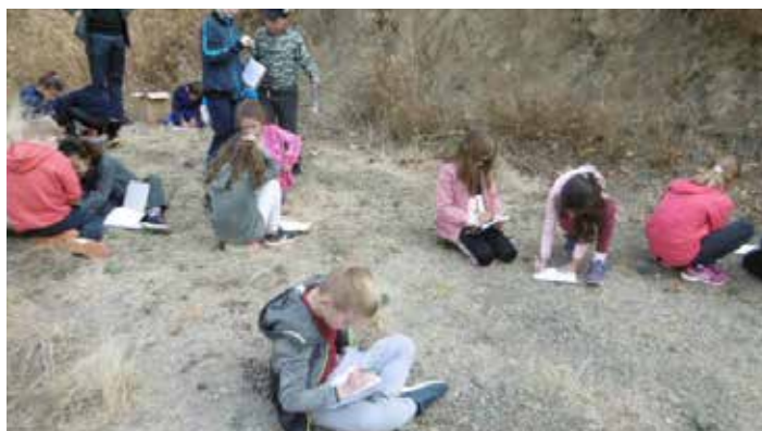
Sortie pour observation des roches avec le chargé de mission dans le cadre de l'intervention avec le géoparc

Cette année c'est le retour de la semaine de 4 jours, après un fonctionnement sur 4 jours et demi durant 4 années. Les TAP, temps d'activité après la classe n'existent donc plus.