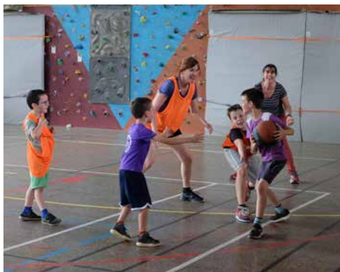
Tournoi des familles