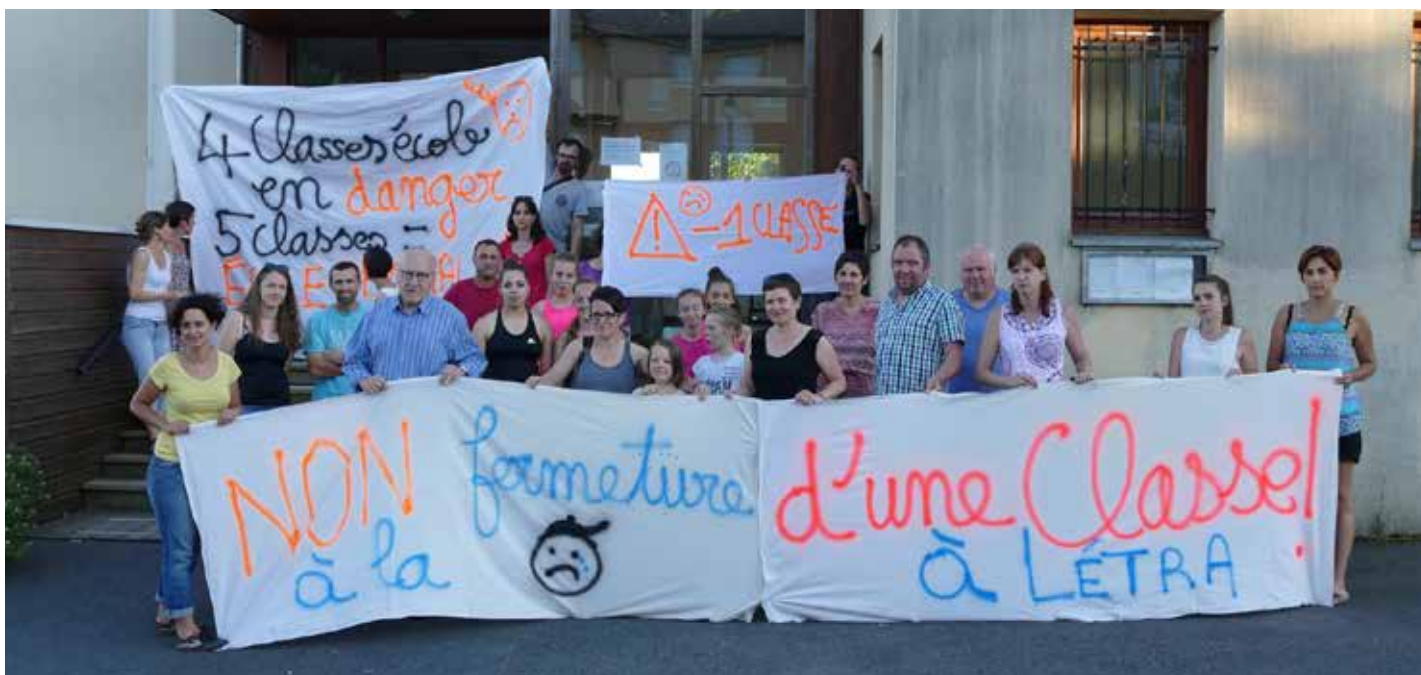
Les parents se mobilisent contre la fermeture d'une classe

Deux auxiliaires de vie scolaire accompagnent des élèves en situation de handicap dans les classes.