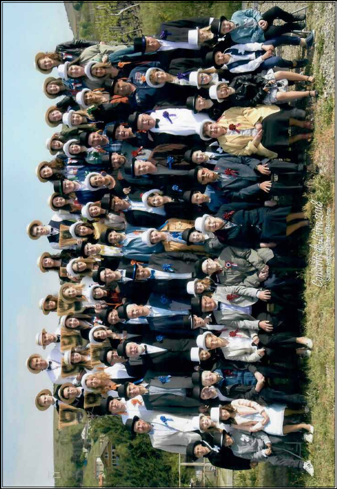
Concerts de Letra 2018 Studio Fotografico - 034604788