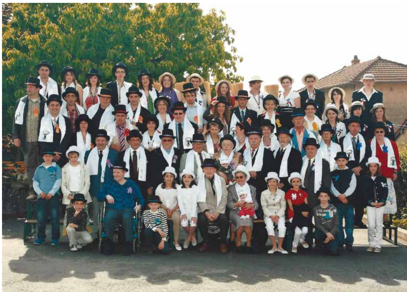
Photo de groupe en 2009