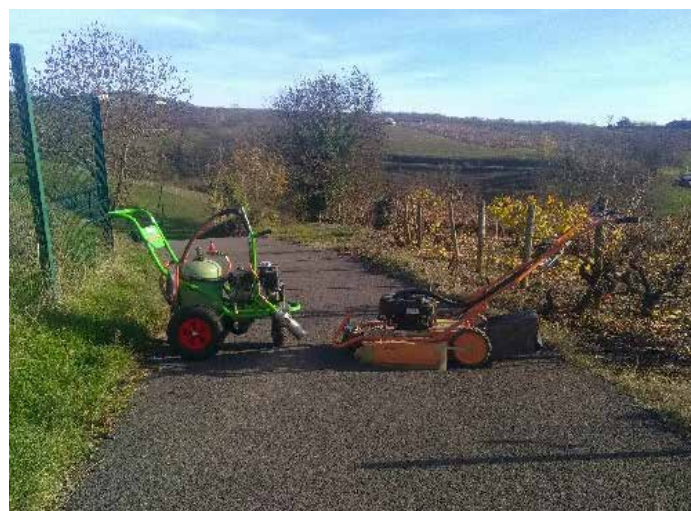
Brosse de désherbage AS MOTOR et désherbeur thermique KERSTEN

Merci à notre employé communal d'assurer ce surplus de travail.