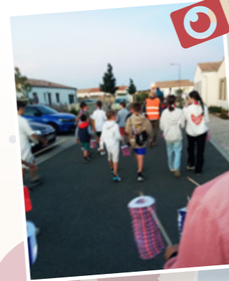
Fête du 13 juillet 2024 et Retraite aux flambeaux suivi du traditionnel feu d'artifice • Organisation Enfantastic et Mairie de St-Ouen