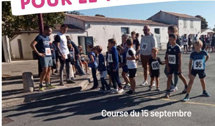
Course du 15 septembre

L'association Expressions Audoniennes a choisi la date du 15 septembre pour une nouvelle édition de cette course dont les bénéfices sont entièrement reversés à l'AFM TÉLÉTHON.