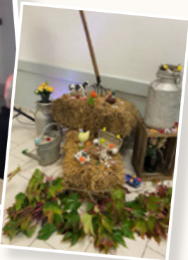
Soirée Halloween du 31 octobre

Une soirée dansante qui a réuni petits et grands Organisé par l'APE