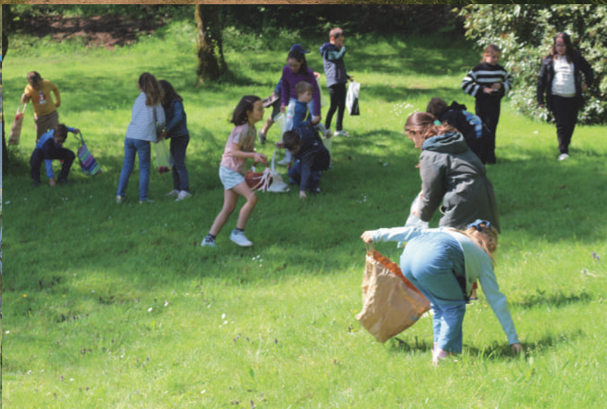
La chasse à l'oeuf