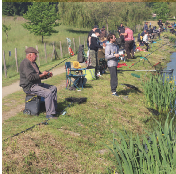
Pêche à la truite