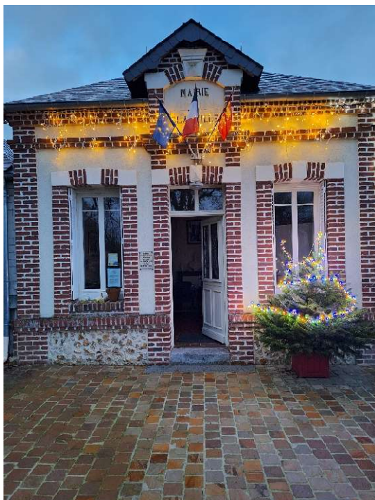
La mairie sous ses parures de fête.