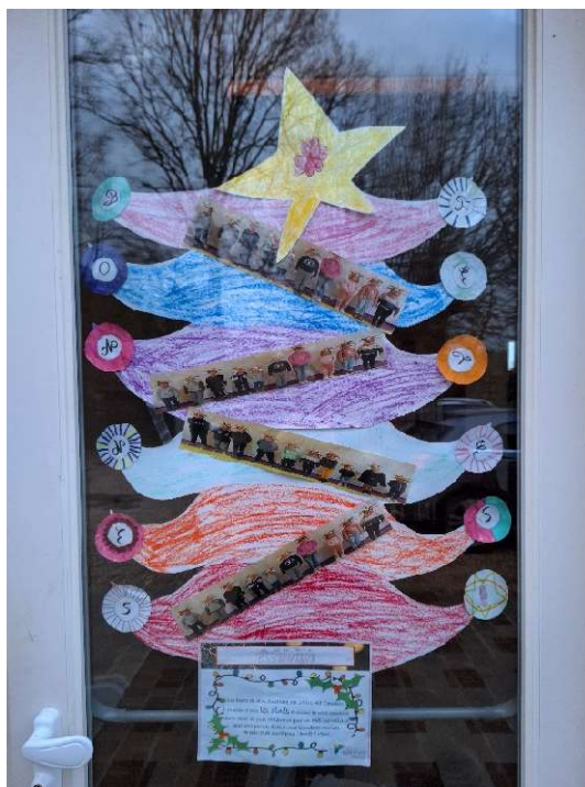
Réalisation du centre Mil'couleurs pour les aînés