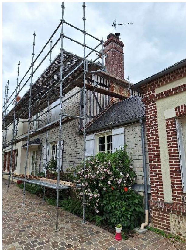
Logement mairie : remplacement gouttières