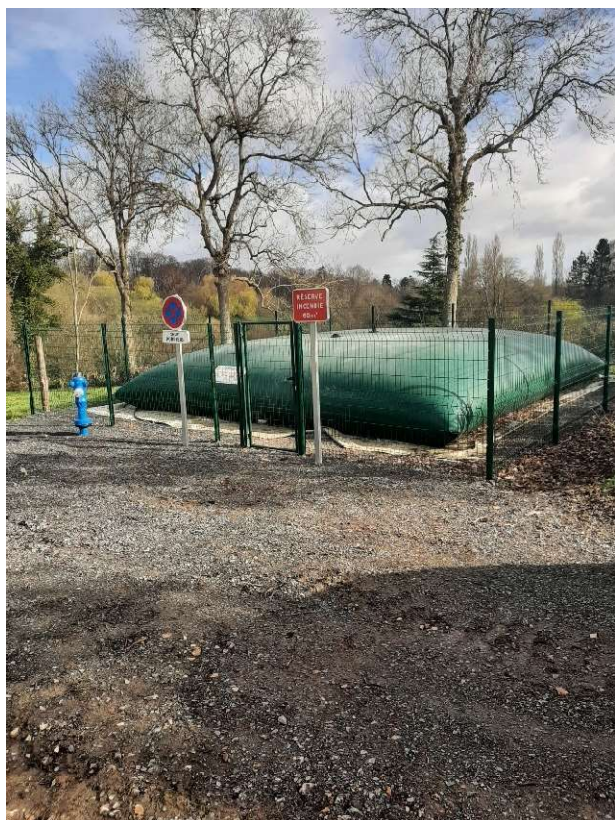
Bâche incendie chemin de Longueline