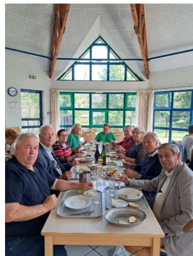
Les récentes réalisations de Terre d'Auge présentées aux maires le 25 juillet 2023