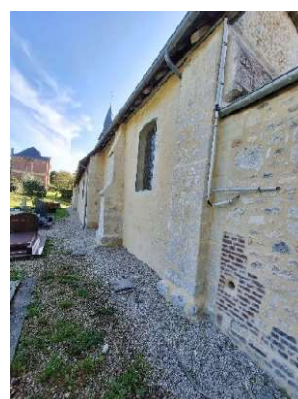
Travaux au cimetière communal et maçonnerie extérieure de l'église