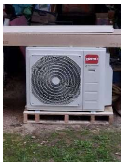
Pompe à chaleur Air/Air