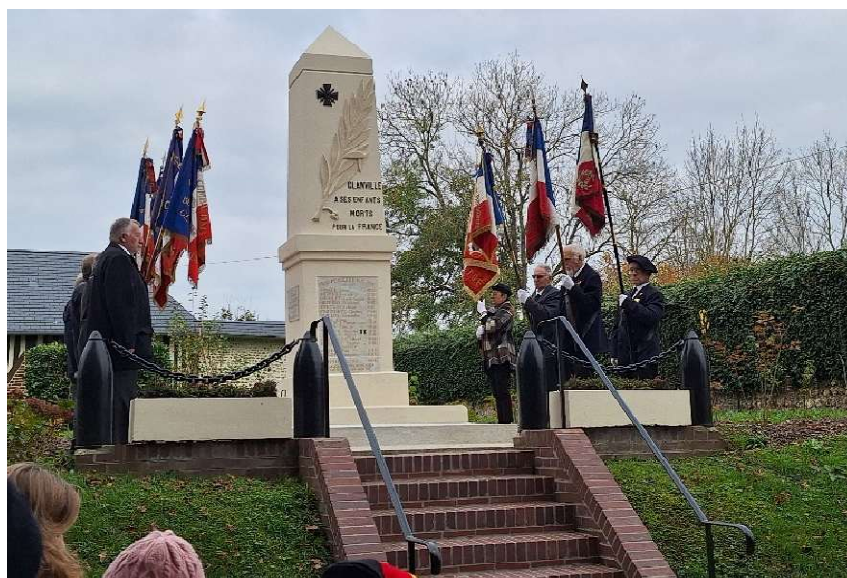
à Glanville le samedi 16 novembre 2024 en présence d'un groupe de jeunes scouts (8-11 ans) de Deauville-Trouville.