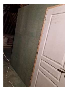
Isolation du grenier et la pose d'une porte