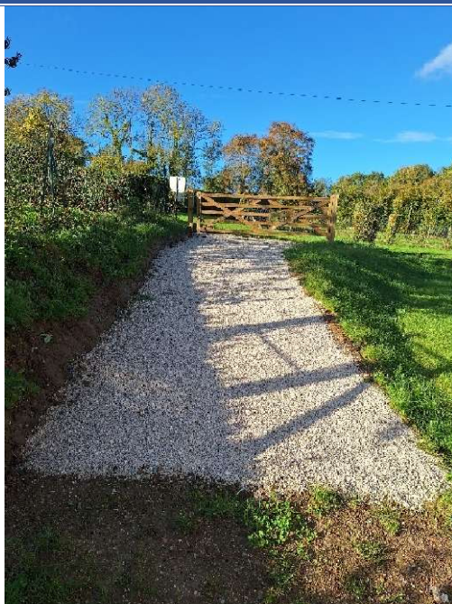
Nouvel accès véhicules