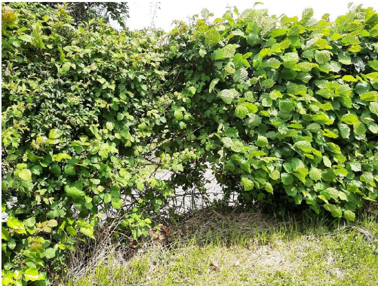
Haie du cimetière dégradée