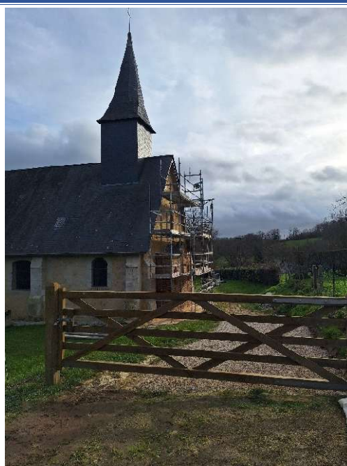
Barrière pour l'accès véhicules