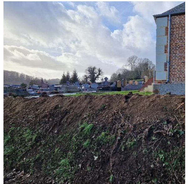
Arrachage des haies