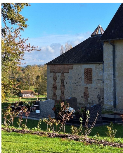
Nouvelle haie du cimetière (essences locales)