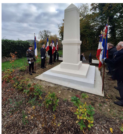
Autour du monument aux morts,