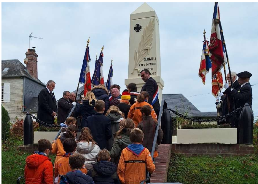
Les scouts ont salué chacun des porte-drapeaux