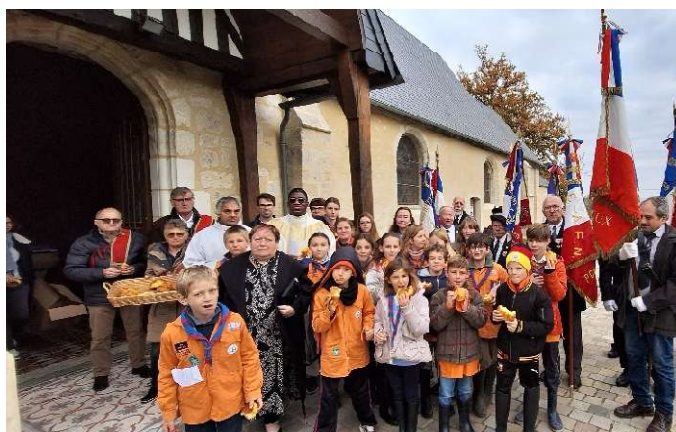
A la sortie de la messe de commémoration du 11 novembre