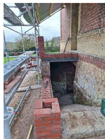
Travaux en cours