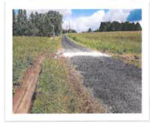
Mariot Réparation traversée route fossés

Installation, sur l'ensemble du territoire communal, de nouveaux panneaux indicateurs :