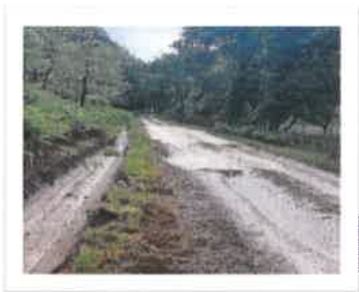
Maragou Réfection busage et fossés