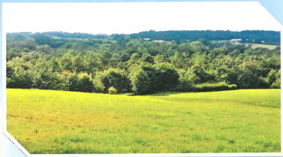
En quittant La Croix de Chiron, vue vers La Cabane