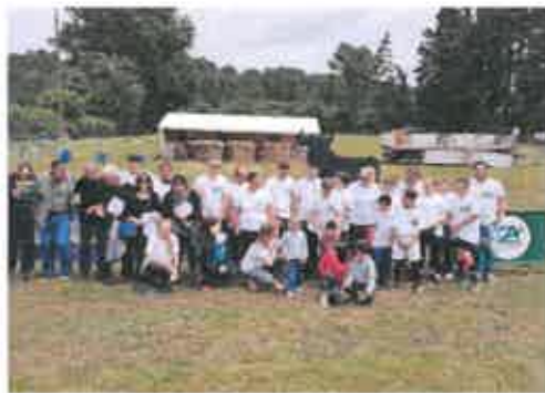
Notre équipe de fiers Genétouziens

Côté sportif, La Genétouze a terminé 2 ème derrière La Barde gagnante et organisatrice de l'édition 2018.