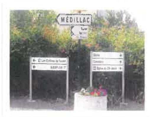
Carrefour du bourg