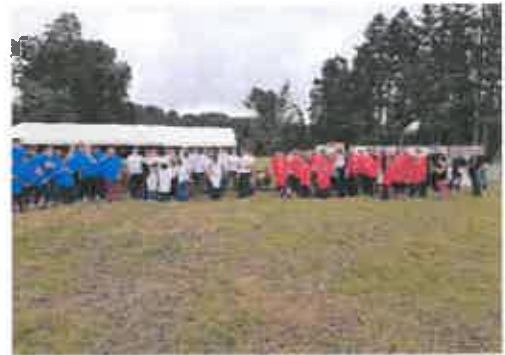
Les 3 équipes réunies