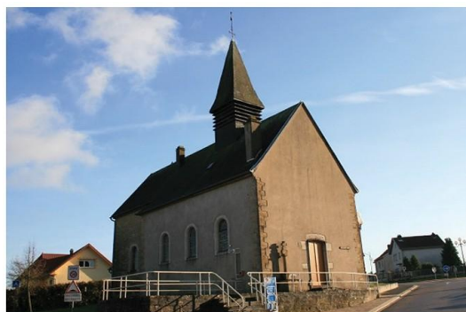
Chapelle Notre Dame de Bure

Sous l'ancien régime, la Chapelle Notre-Dame de Bure faisait partie de la seigneurie de Bassompierre et du diocèse de Luxembourg. Selon la légende, elle pourrait avoir deux origines : Carolingienne : Charlemagne se serait arrêté à cet endroit, miraculeuse : au VII e siècle, en réponse à la prière des habitants dépourvus d'eau, la Vierge aurait fait jaillir une source au centre de Bure.