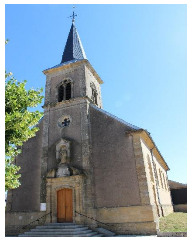
Église Saint-Pierre de Tressange

Presbytère : 1 rue Ste Barbe 57710 AUMETZ