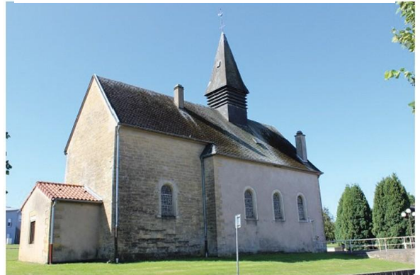
Chapelle Notre Dame de Bure