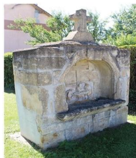
Calvaire de Ludelange

À Ludelange se dresse un calvaire avec Pietà datant de 1693.