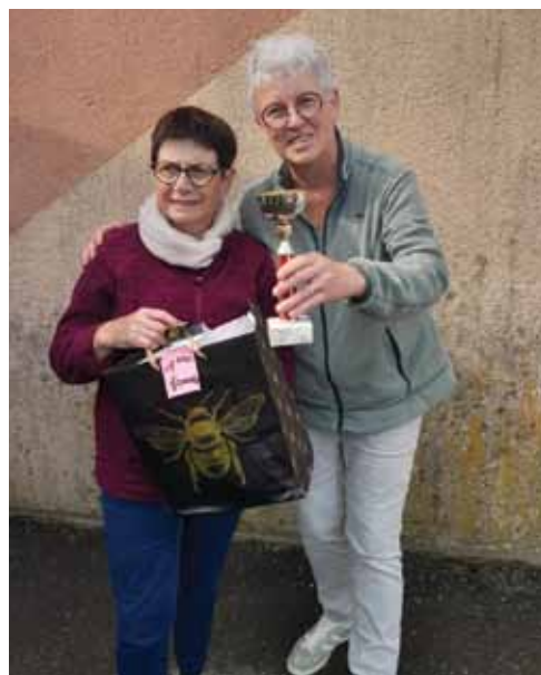
Coupe féminine palets