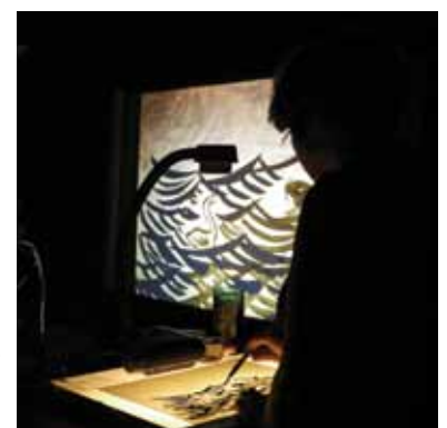
Les artistes de la Compagnie OOO

Vous voulez nous aider, vous avez des nouvelles idées d'animations, contactez-nous par mail, téléphone, ou en venant nous voir.