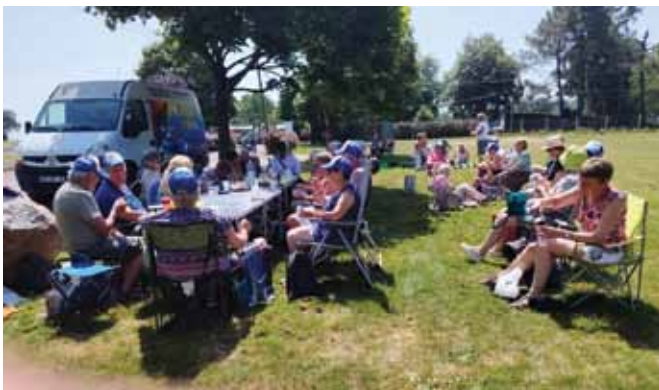
Fête de l'amitié à Maure-de-Bretagne

Le reste du temps, les activités habituelles ont connu une bonne fréquentation. La pétanque, les jeux de société (belote, tarot, scrabble, etc...) et l'art floral. Le tricot a vu sa fréquentation baisser et s'est mis en vacances jusqu'à la rentrée de septembre. Les sorties et voyages ont aussi attiré leur public. 4 adhérents ont visité la Corse, 8 sont inscrits pour le séjour vacances ANCV en septembre et 2 voyageront en Martinique. Un séjour de 2 jours à Bénodet est également en préparation pour septembre. Un spectacle de chansons françaises est programmé par la fédération début décembre. Toutes ces activités témoignent de la bonne santé de notre club de l'amitié. Il est ouvert à toutes et à tous, moyennant une adhésion au club. N'hésitez pas à venir découvrir notre offre d'activités et la convivialité qui règne dans nos rencontres.