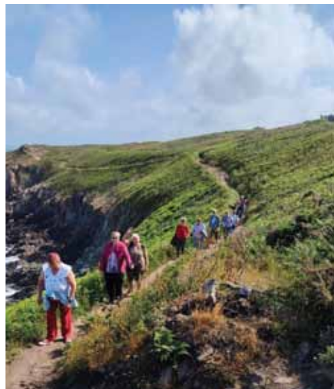
Randonnée à Cancale